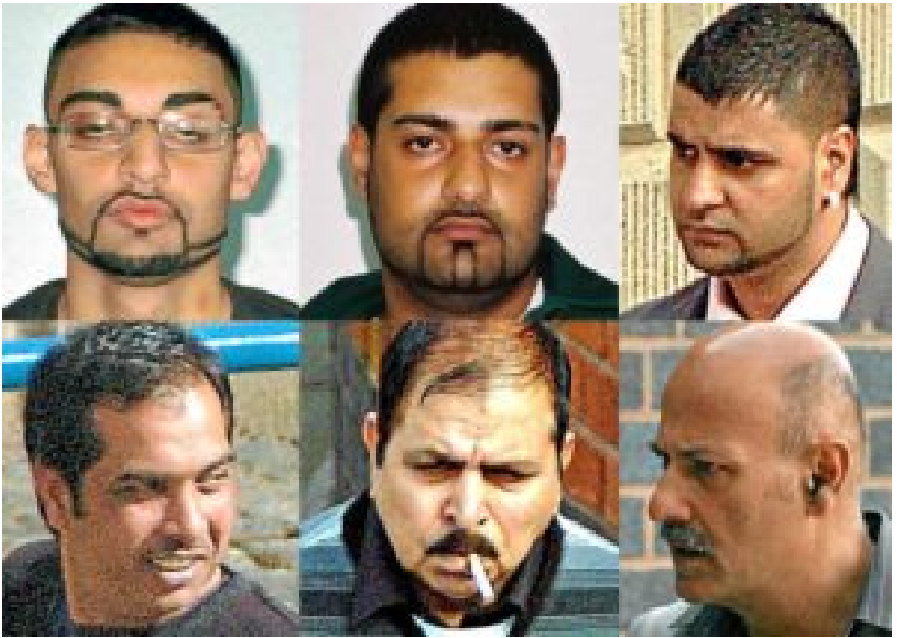
Gang de Telford