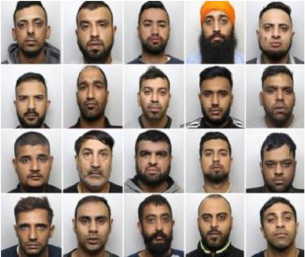
Gang de Rotherham