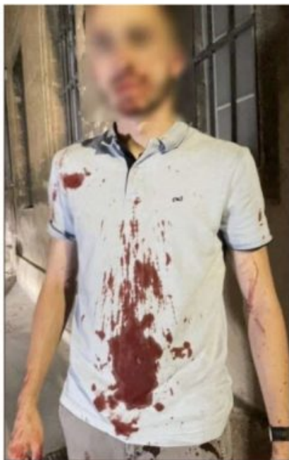
Pied cassé, fracture de la mâchoire, traumatisme crânien... les cinq jeunes policiers Chalonnais sont toujours en arrêt de travail.

écrit par Christine Tasin | 19 juillet 2022