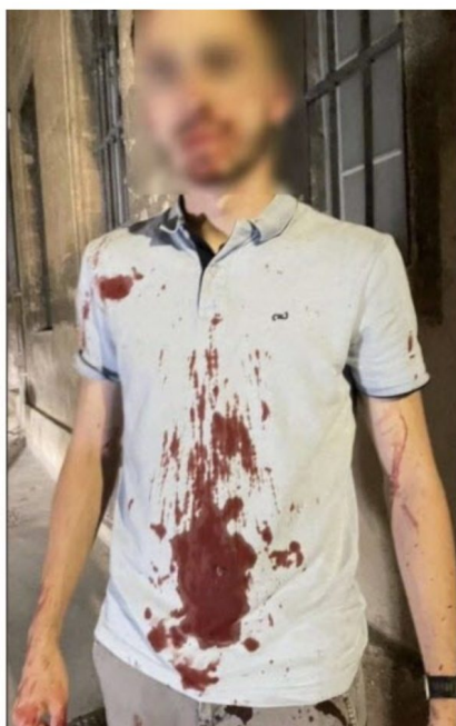
Pied cassé, fracture de la mâchoire, traumatisme crânien... les cinq jeunes policiers Chalonnais sont toujours en arrêt de travail.