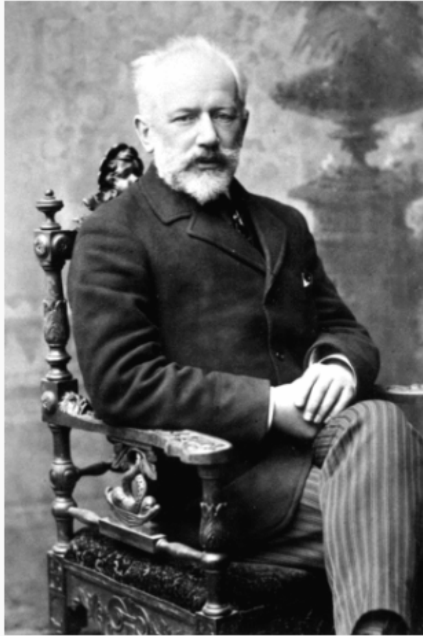
Dernier portrait en 1893