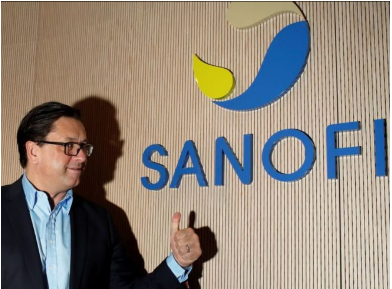
Photo : Paul Hudson (ex-PDG de Novartis Pharmaceuticals) , directeur général de Sanofi