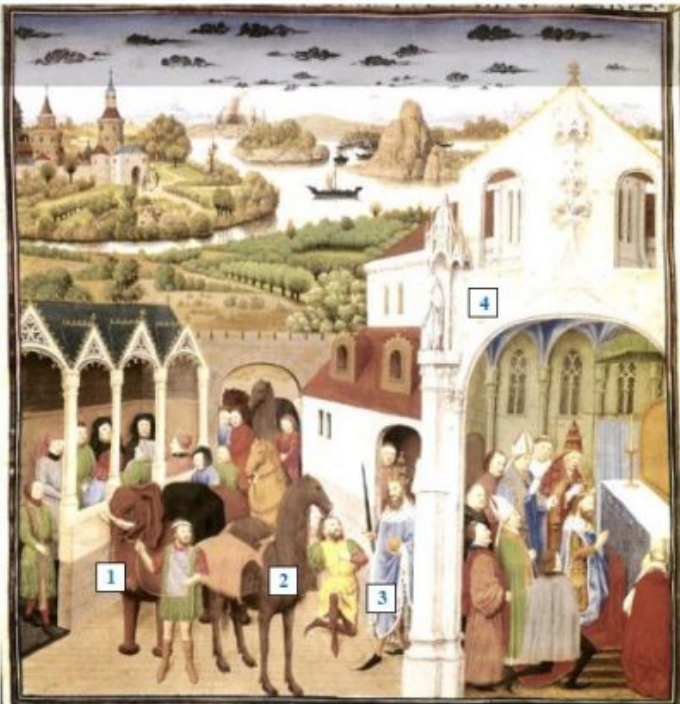
Miniature, Trésor de l'Abbaye de Saint-Maurice (Suisse), XVème s.