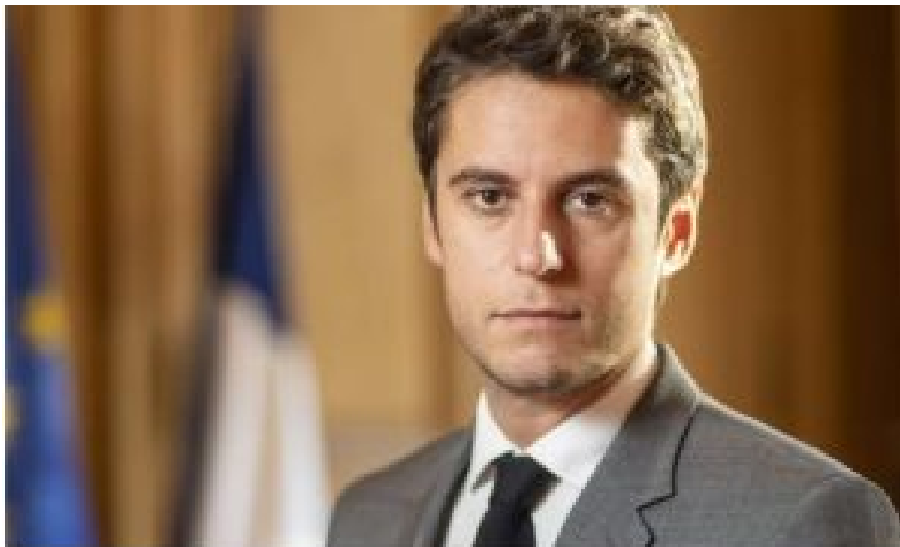
Gabriel Attal, ministre des Comptes publics.

Gabriel Attal prévient qu’un “effort global” sera demandé aux Français en 2024 pour “réduire la dette”