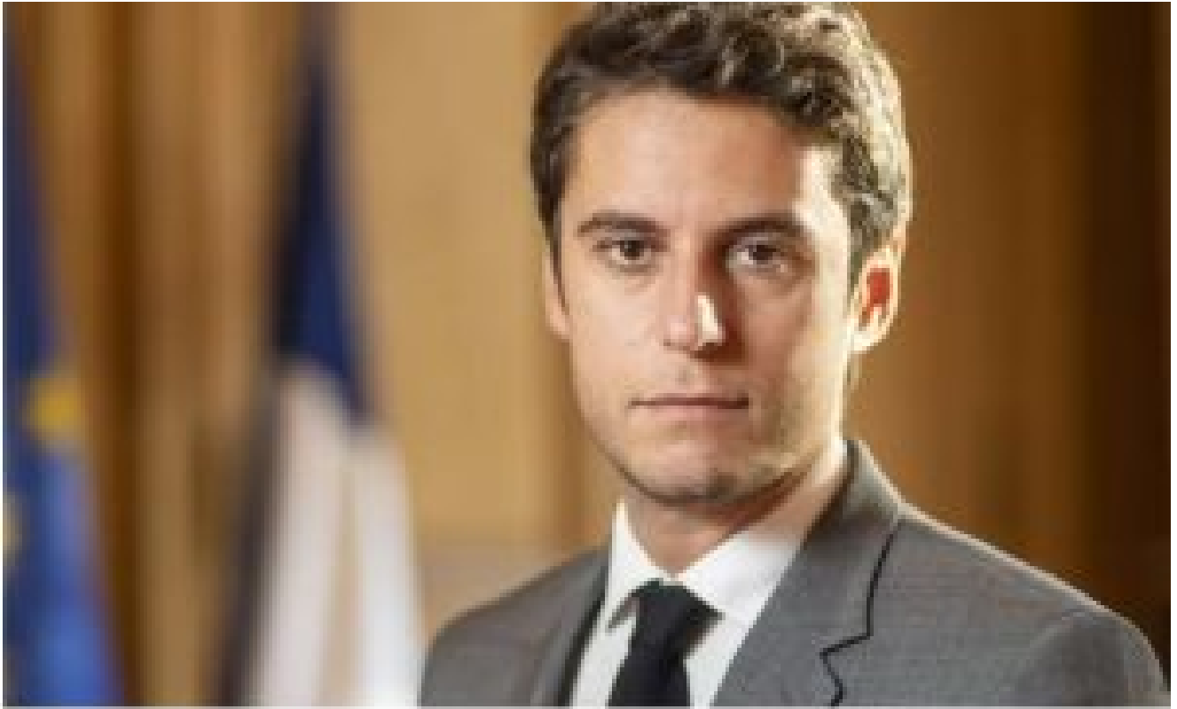
Gabriel Attal, ministre des Comptes publics.

La Macronie, c'est la fable de la cigale mais... à l'envers. A la fin, c'est la cigale qui fait raquer la fourmi qui... en redemande.