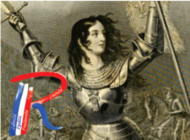
Nique La Tantine A Charlie

écrit par Christine Tasin | 26 janvier 2015