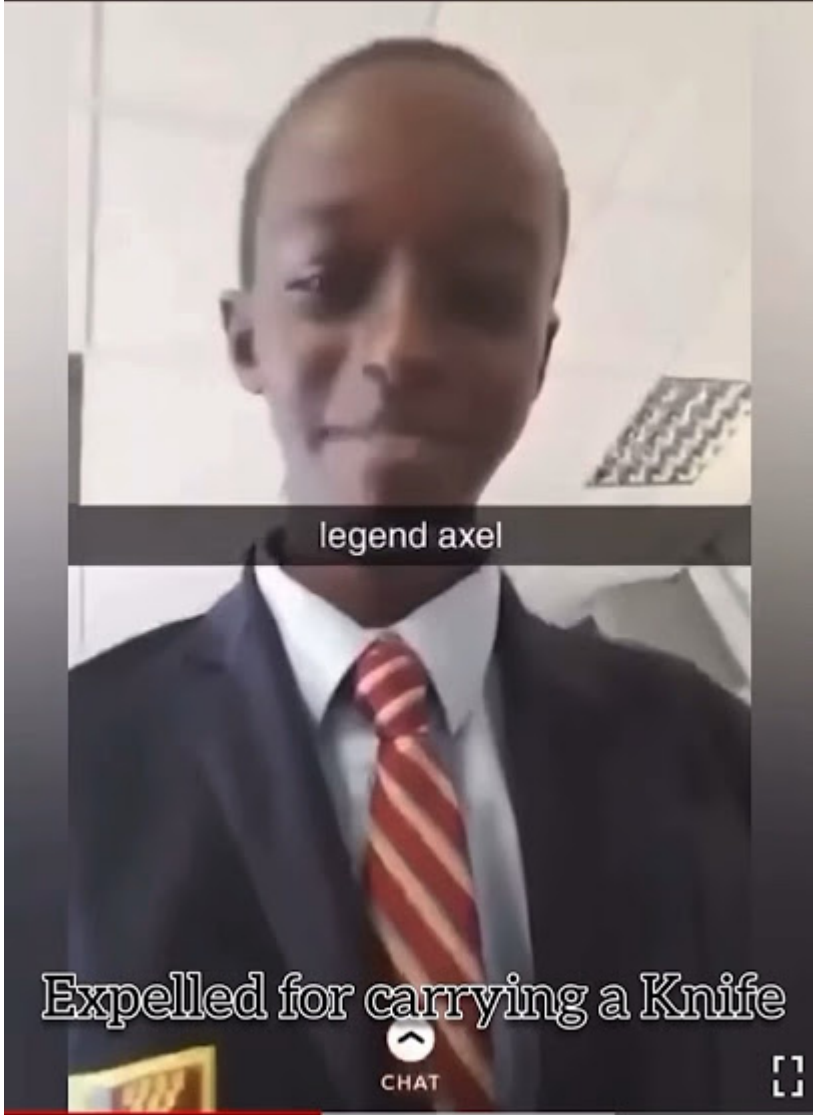
#Axel #Muganwa #Rudakubana the #Southport Killer. Known to Police. #britain