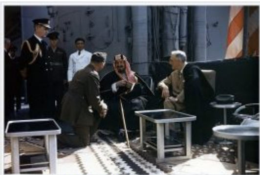
Le président Franklin Roosevelt en compagnie du roi Abdelaziz Al Saoud , du colonel William A. Eddy ( en ) (qui sert d'interprète, un genou au sol) et de l'amiral William Leahy (debout, à gauche) sur l'USS Quincy .

Fin de la domination américaine. L'Arabie Saoudite accepte de vendre son pétrole contre yuan, euros et autres monnaies. Ce qui signifie que les pays exportateurs de pétrole comme l'Arabie saoudite ne sont plus obligés d'investir aux USA le produit de la vente du pétrole... Une sacrée mauvaise nouvelle pour les USA.