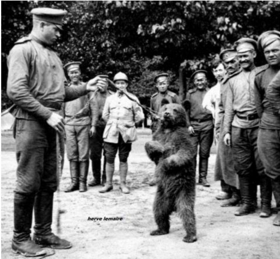
Photo très connue, de la venue des 3 ème & 5 ème régiments d'infanterie russes avec leur mascotte, un ours.

Sur le sujet des animaux pendant la Grande Guerre, voir le magnifique exposé en 4 parties de Cachou !