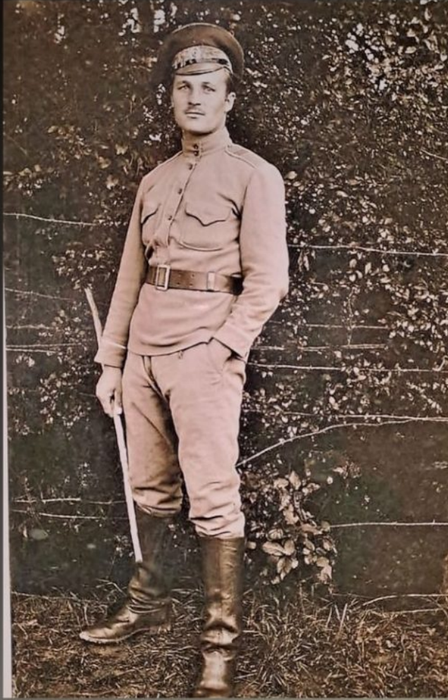
Feodor Nikolaïevitch Mamontoff 1917, France