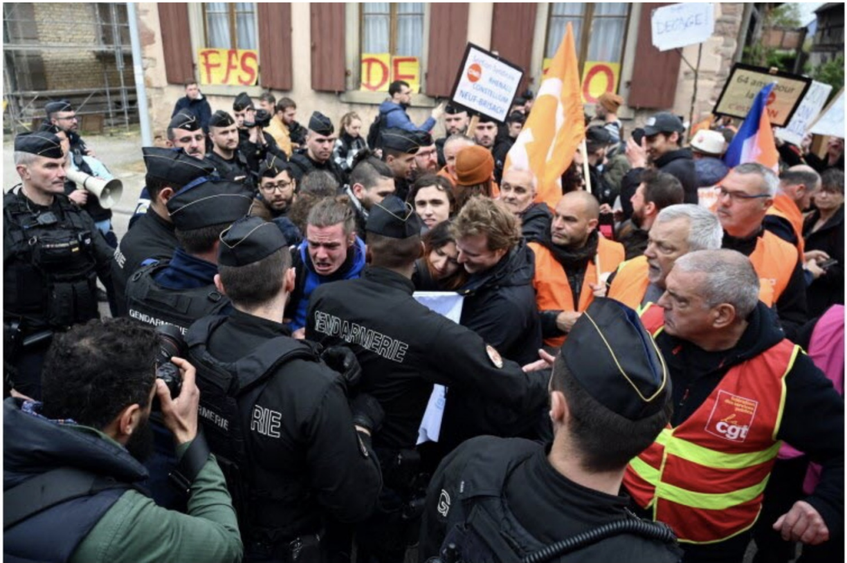
16 Les forces de l'ordre repoussent des opposants à la réforme des retraites lors de la visite de l'entreprise Mathis par le président de la République à Muttersholtz.