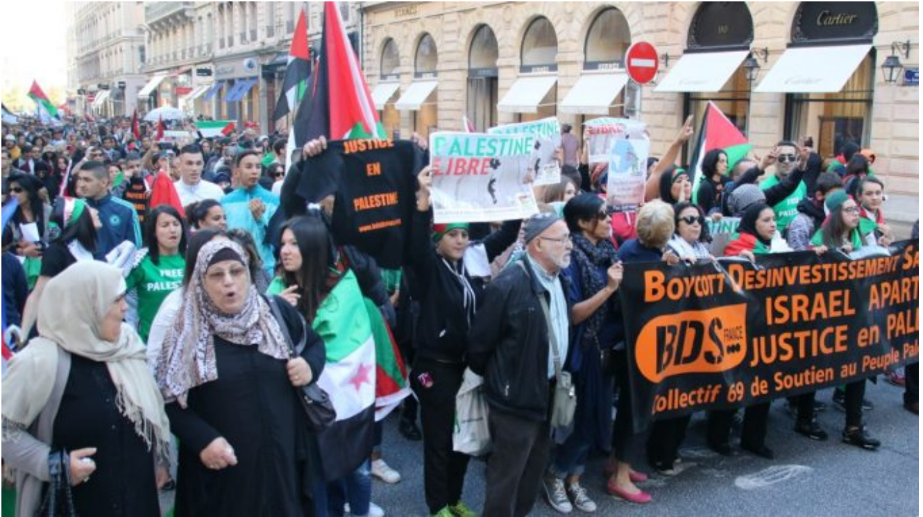
Illustration : manifestation propalestinienne au cœur de Paris

Dans le même temps, l'agresseur lui a donné plusieurs coups de poing au visage.