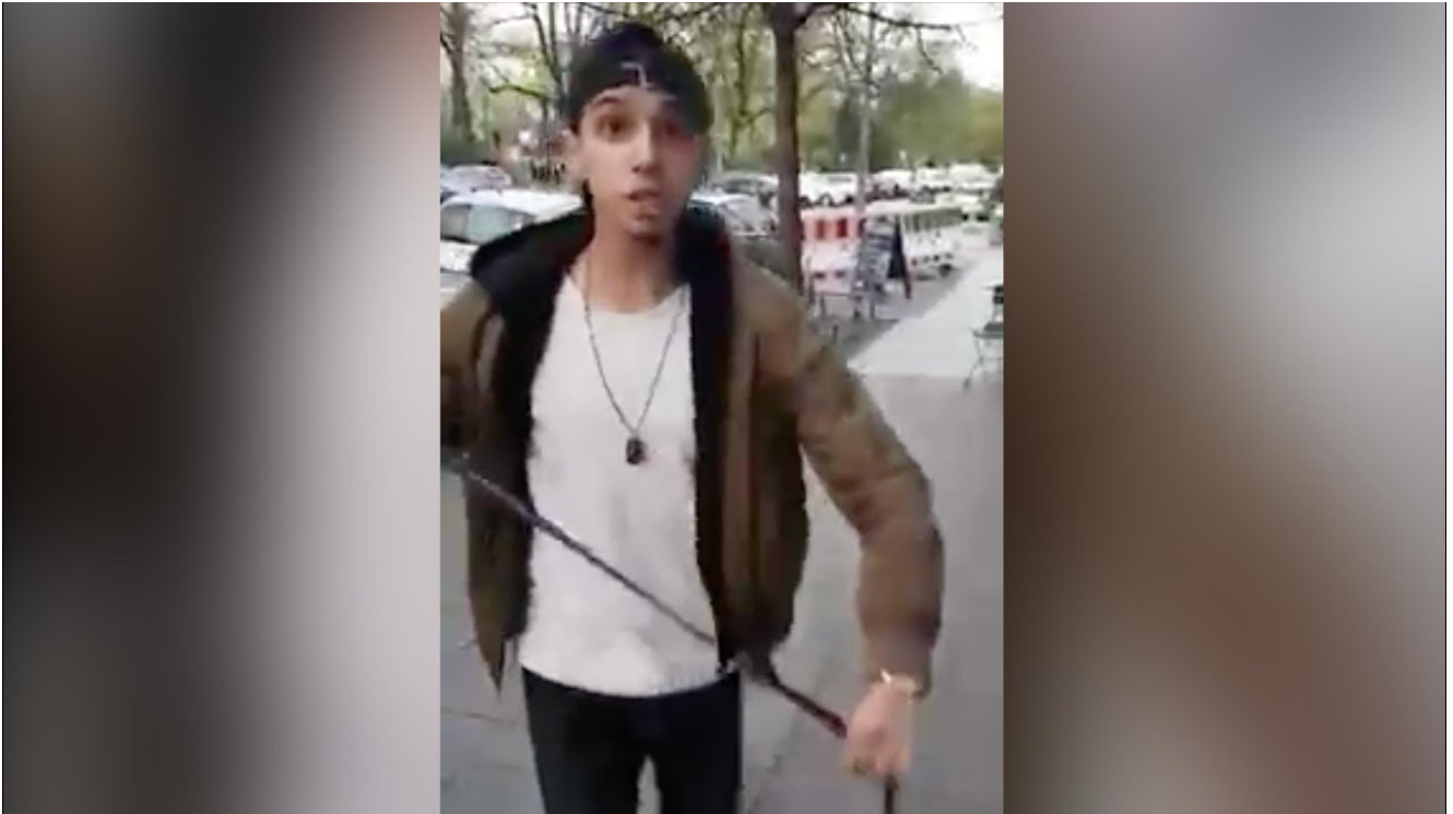
Illustration : attaque à la ceinture, insultes en arabe. Peut-on encore porter la kipa à Berlin ?

Revue de presse spéciale « haine des Juifs » : attaques dans la rue, coups, violences, c'est le djihad.