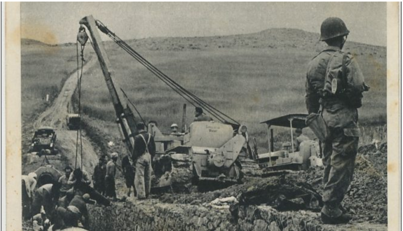
1956 construction d'une route