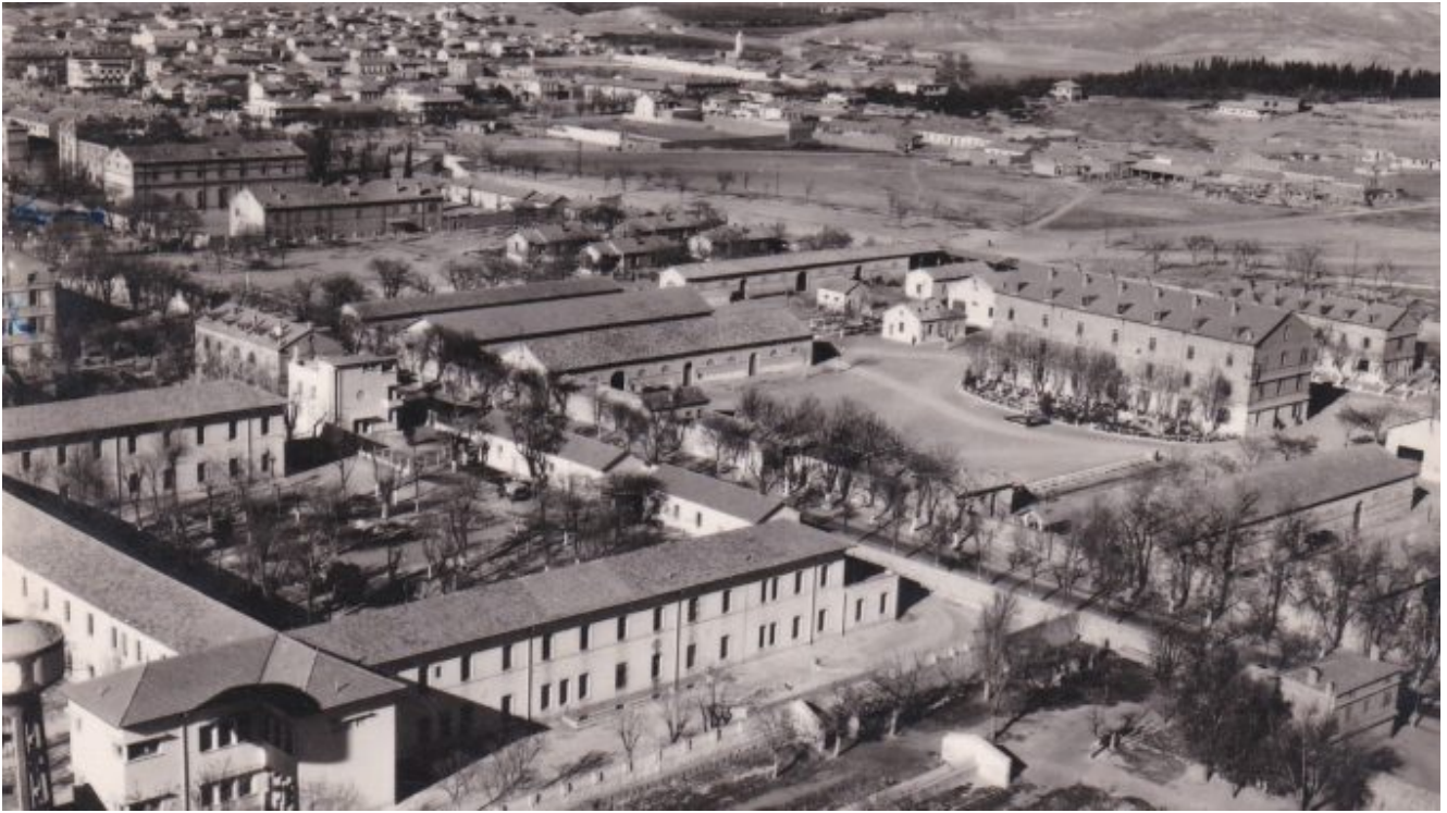
ALGERIE . BATNA. Vue Aérienne sur l'Hôpital