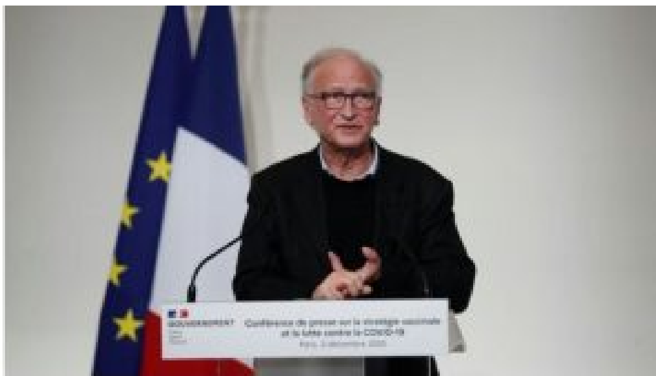
L'immunologiste Alain Fischer s'exprime lors d'une conférence de presse sur la stratégie de vaccination, le 2 décembre 2020 à Paris.

Quatrième dose de vaccin contre le Covid-19 : pour Alain Fischer, « la question est sur la table »