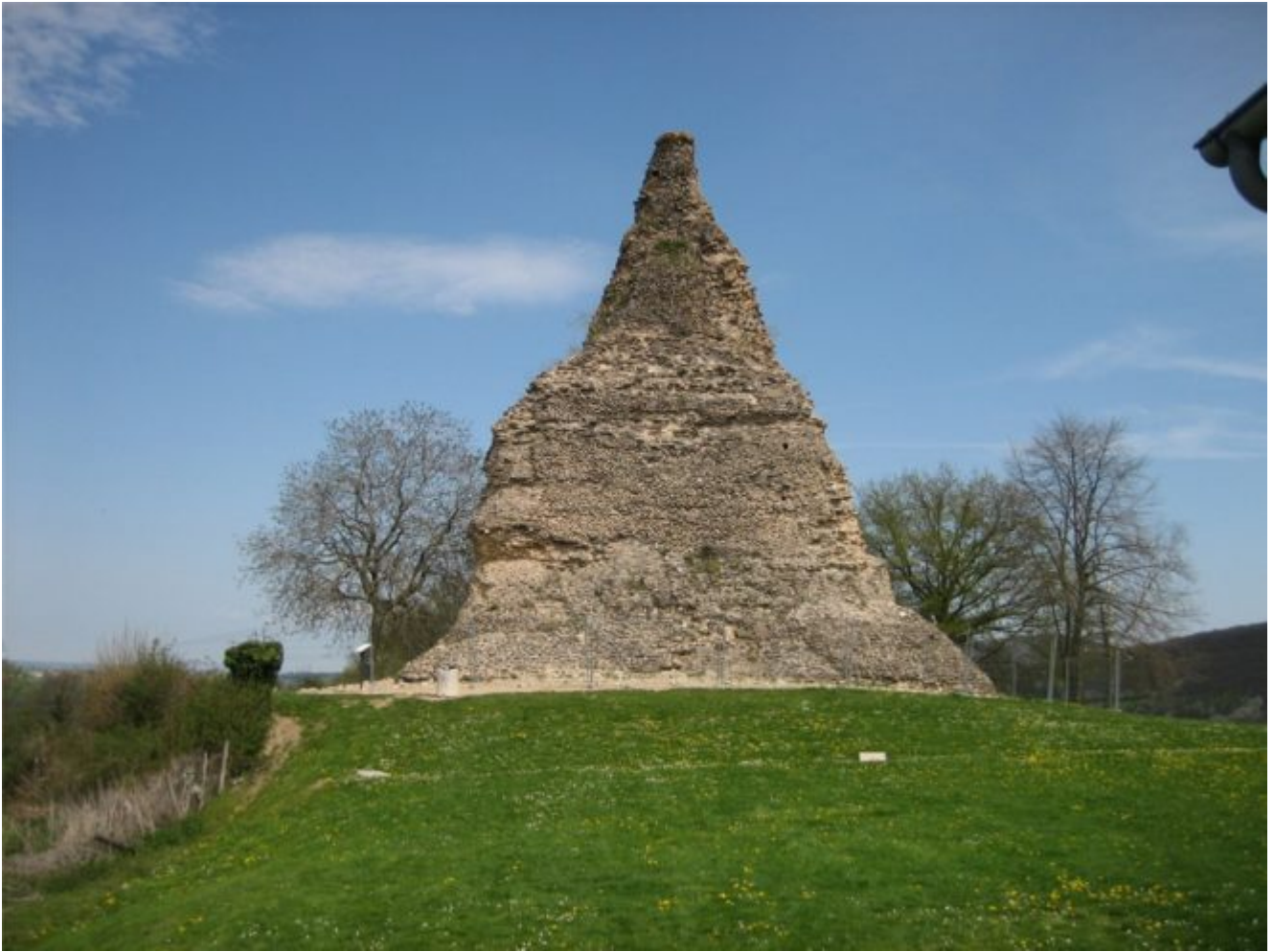
Illustration : la pyramide de Couhard, près d'Autun