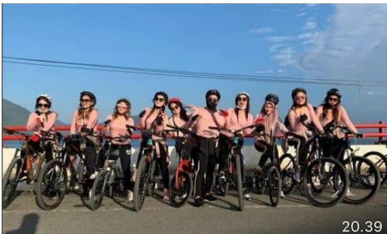
Illustration : Une histoire semblable début 2020, ici des jeans trop suggestifs pour la police de la charia à Aceh.. Dans la province indonésienne d'Aceh, la police de la charia arrête les filles en jeans et les force à porter une jupe fournie par le gouvernement (juin 2020, détails ici ).

Le club de cyclisme féminin d'Aceh est recherché par les autorités locales pour avoir roulé en “vêtements sexy”