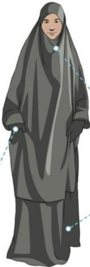
Illustration tirée du site de promotion de la charia (en français) : Le Code Vestimentaire selon le Coran , allure du musulman.

Le vernis à ongles est proscrit, car il empêche l'eau d'atteindre le corps lors des ablutions. Les gants sont recommandés.