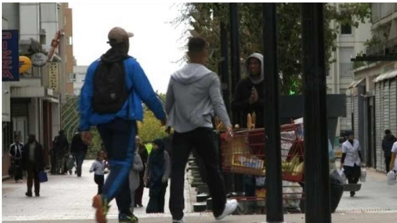
Argenteuil, Val d'Oise.