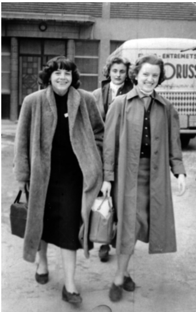
Sortie de l'ancienne usine FrancOrusse (construite en 1892)