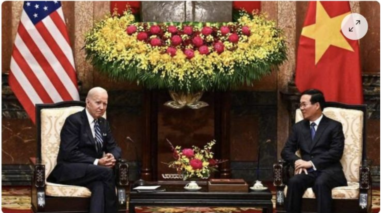
Joe Biden aux côtés du président vietnamien Vo Van Thuon lors d'une rencontre au palais présidentiel à Hanoï au Vietnam, lundi 11 septembre 2023.

écrit par Christine Tasin | 13 septembre 2023