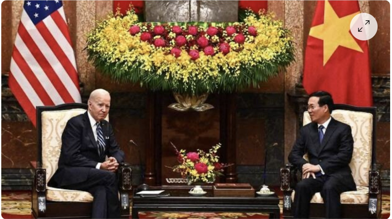
Joe Biden aux côtés du président vietnamien Vo Van Thuon lors d'une rencontre au palais présidentiel à Hanoï au Vietnam, lundi 11 septembre 2023.

A Hanoï, au Vietnam, pépère était tellement à l'ouest que la porte-parole de la Maison Blanche a interrompu l'entretien et a obéi au débile qui, en pleine discussion politique lunaire venait en gros d'ajouter "vous faites ce que vous voulez, moi je vais me coucher", au grand dam de son interlocuteur, Vo Van Thuon, le Président vietnamien, qui a dû sortir de là conforté dans son idée que les Occidentaux font n'importe quoi et n'ont aucun savoir-vivre.