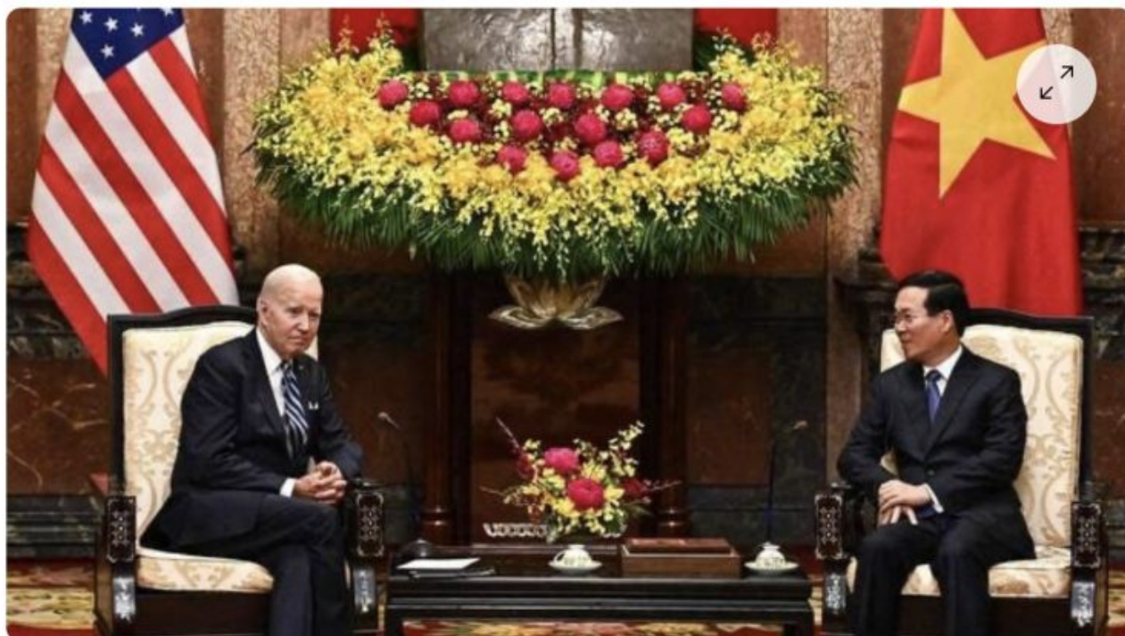
Joe Biden aux côtés du président vietnamien Vo Van Thuon lors d'une rencontre au palais présidentiel à Hanoï au Vietnam, lundi 11 septembre 2023.

écrit par Christine Tasin | 13 septembre 2023