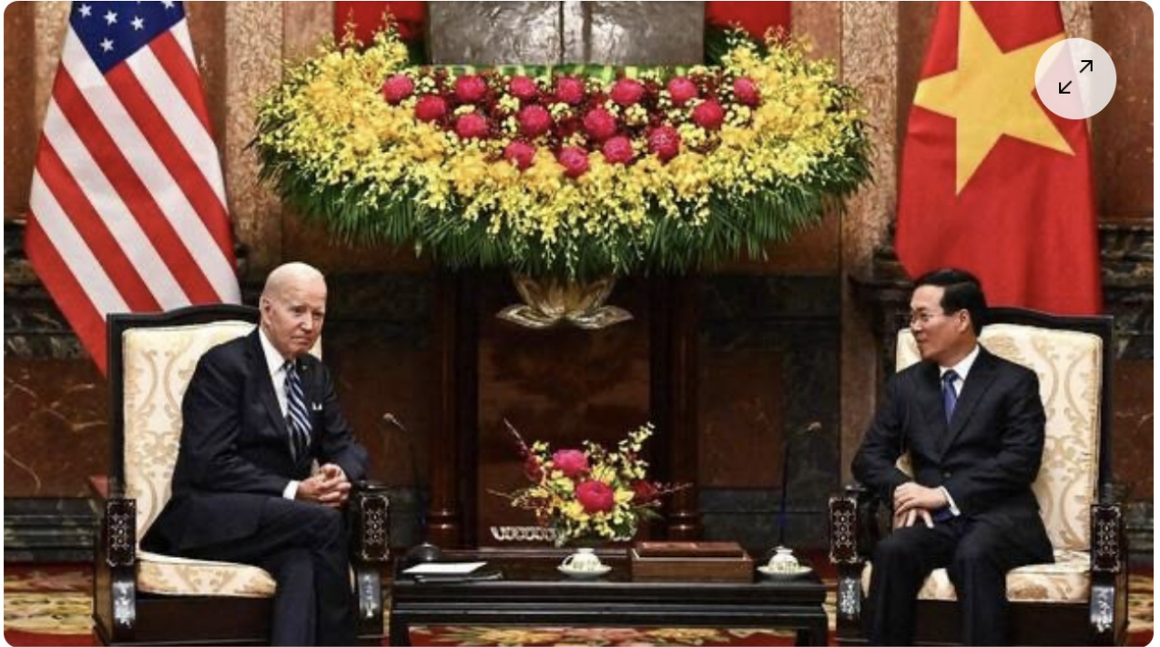
Joe Biden aux côtés du président vietnamien Vo Van Thuon lors d'une rencontre au palais présidentiel à Hanoï au Vietnam, lundi 11 septembre 2023.

A Hanoï, au Vietnam, pépère était tellement à l'ouest que la porte-parole de la Maison Blanche a interrompu l'entretien et a obéi au débile qui, en pleine discussion politique lunaire venait en gros d'ajouter « vous faites ce que vous voulez, moi je vais me coucher », au grand dam de son interlocuteur, Vo Van Thuon, le Président vietnamien, qui a dû sortir de là conforté dans son idée que les Occidentaux font n'importe quoi et n'ont aucun savoir-vivre.