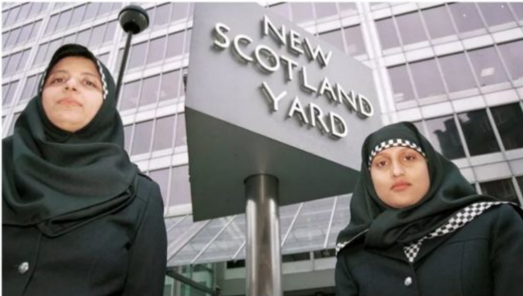
Deux policières portant le hijab devant le siège de Scotland Yard à Londres. METROPOLITAN POLICE/AFP

Ci-dessus : Policières voilées ( source ).