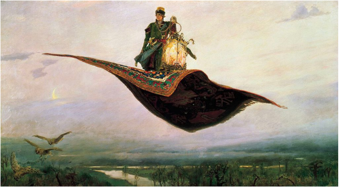
Le Tapis volant, 1880