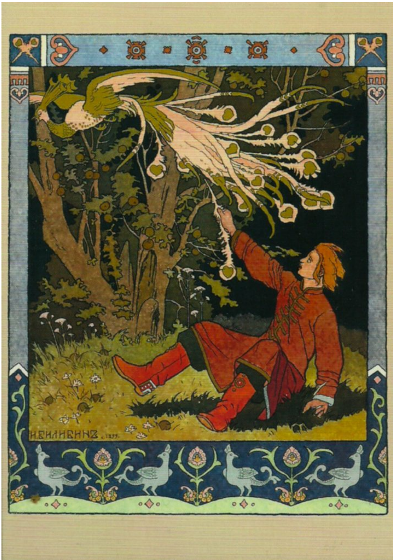
Ivan Tsarévitch et l'Oiseau de feu, 1899