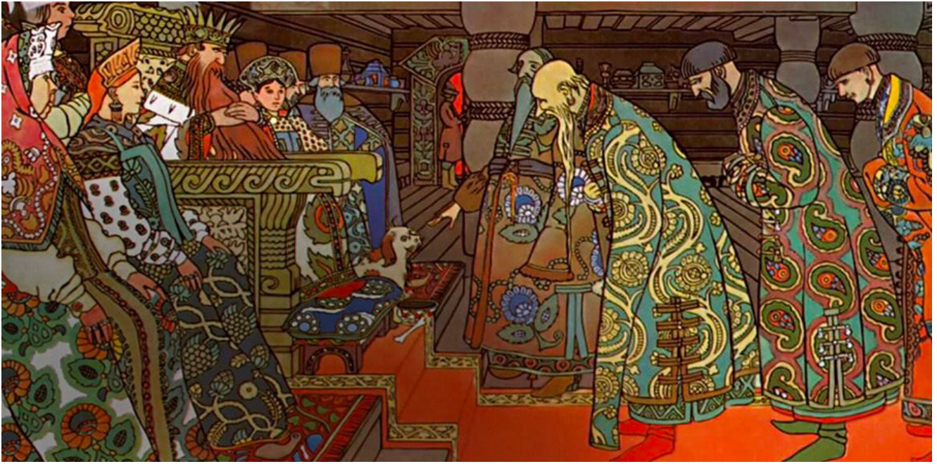
Le Conte du tsar Saltan, 1905