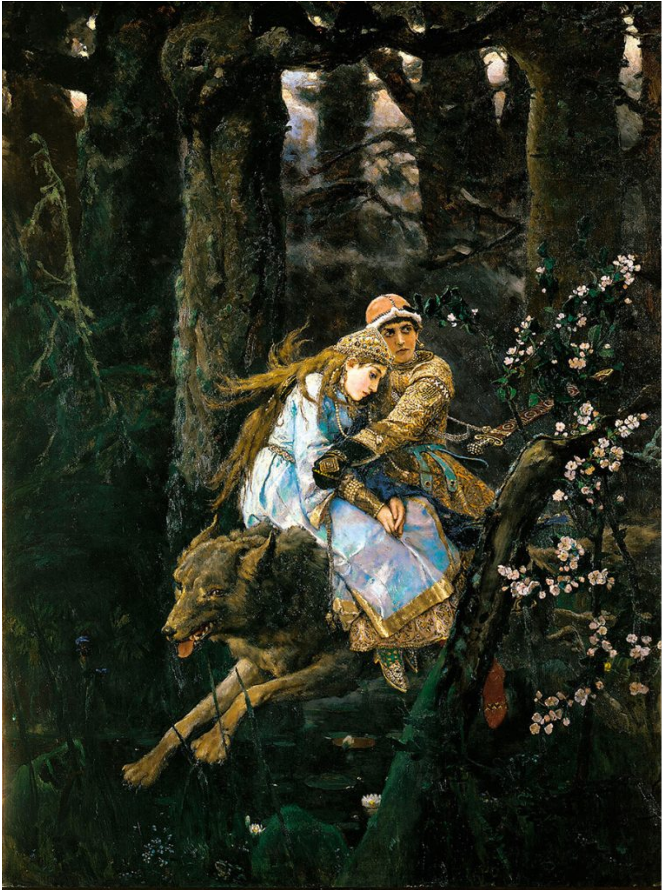
Ivan Tsarévitch chevauchant le loup gris, 1889