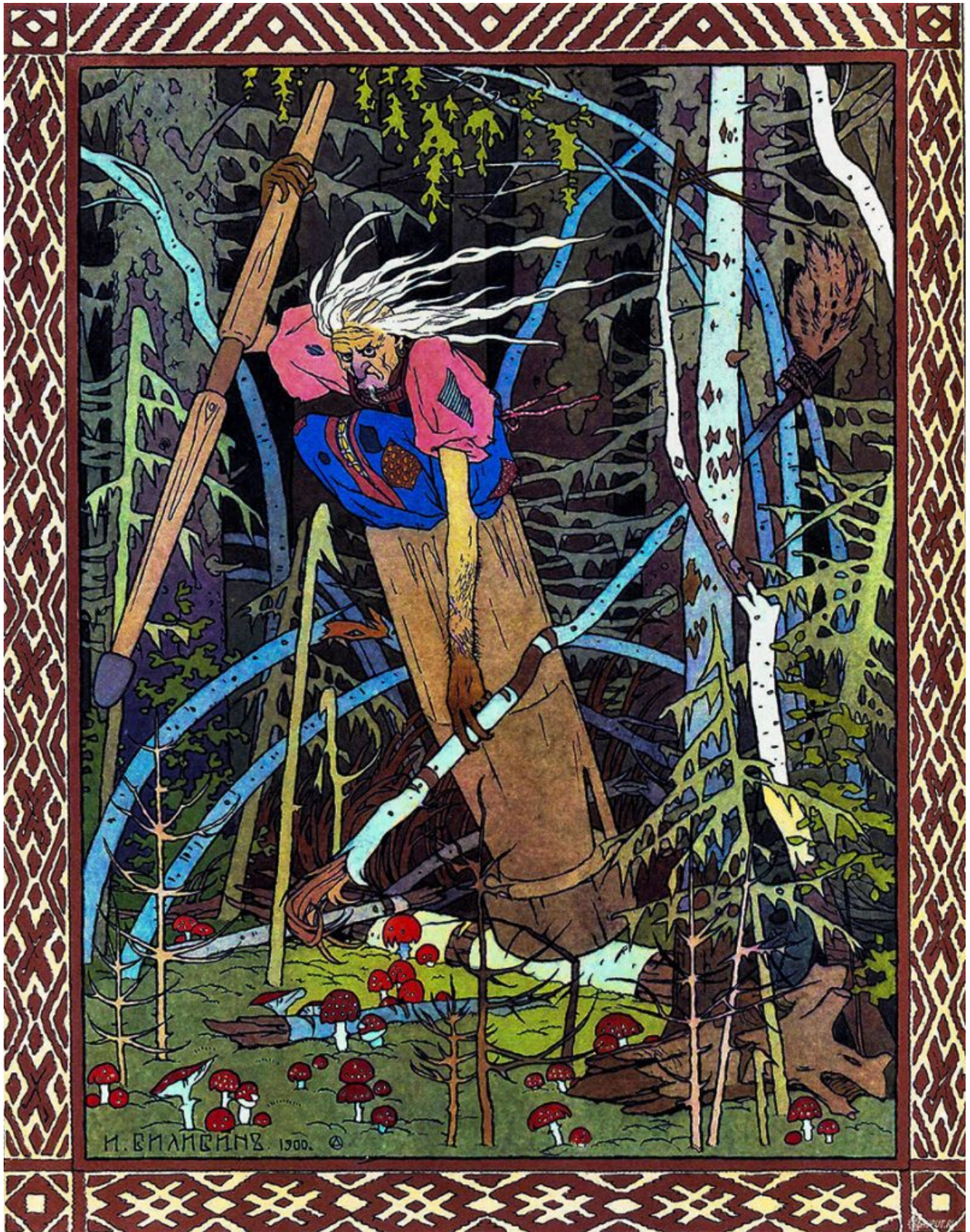
La sorcière Baba Yaga, 1900