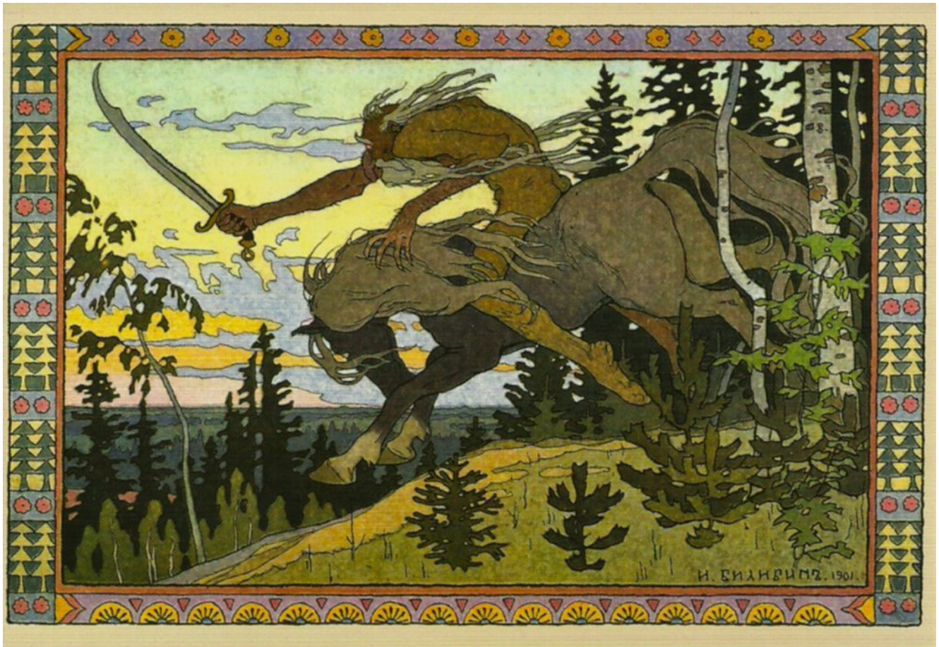
Kochtcheï l'Immortel, 1901