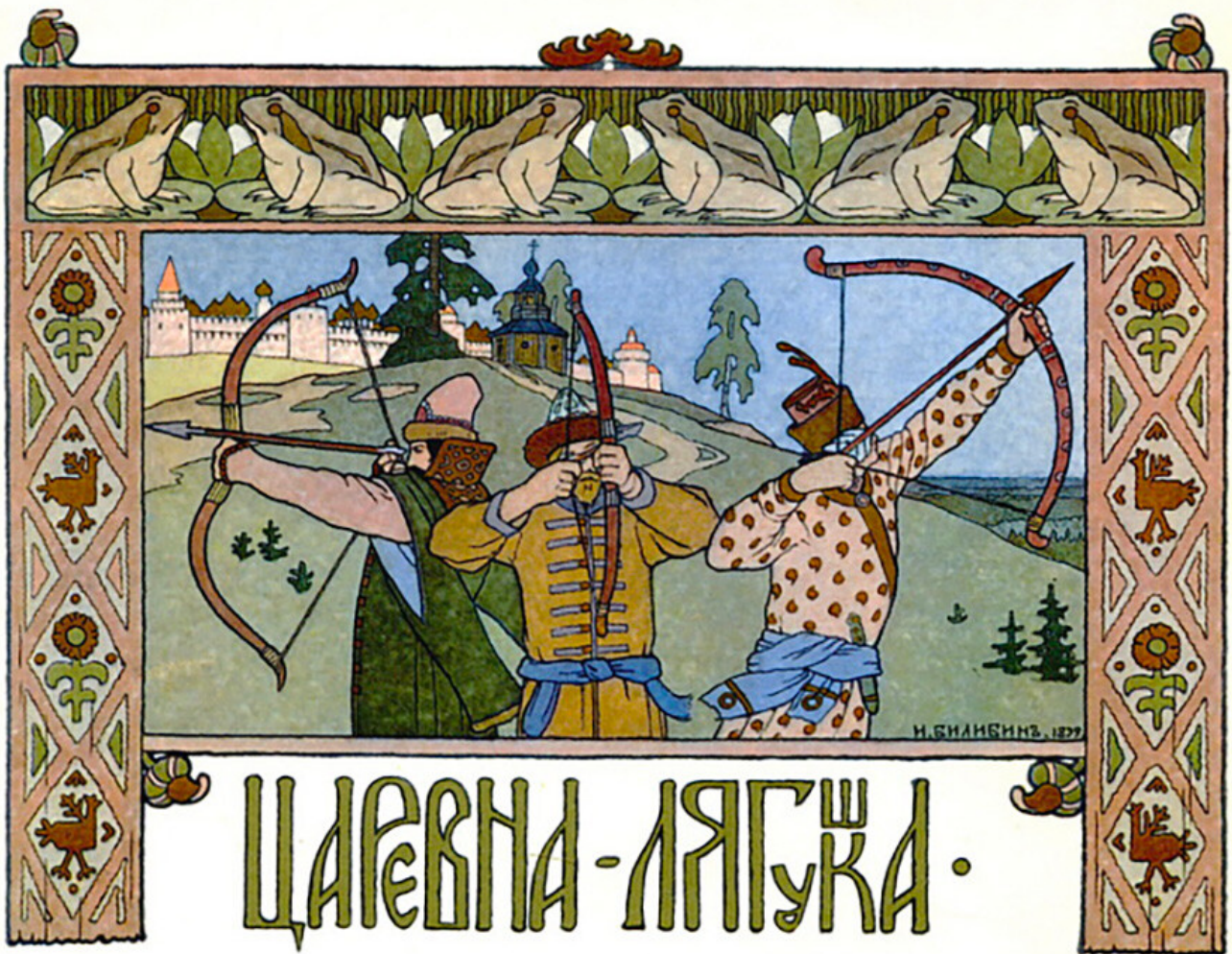
La princesse-grenouille, 1899