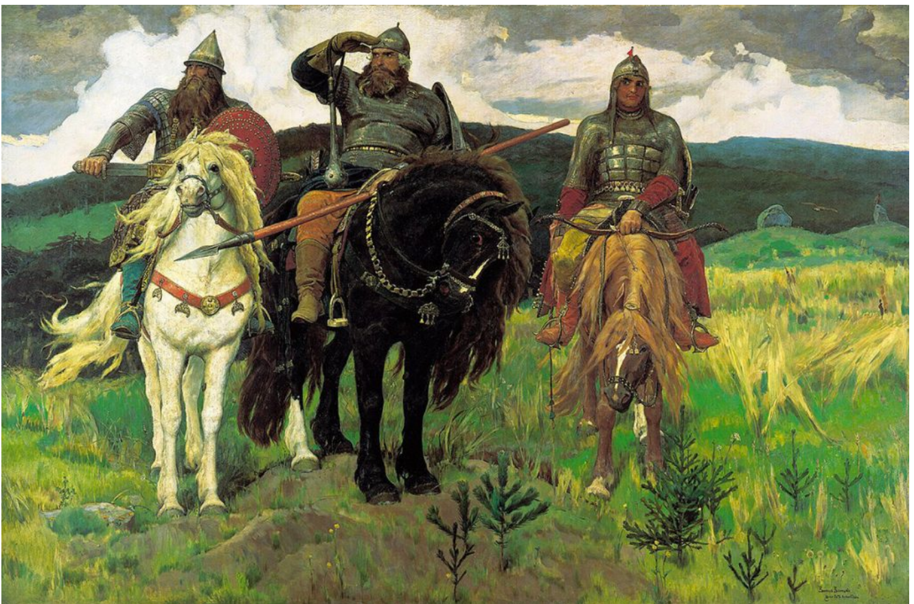
Les Bogatyrs, 1898