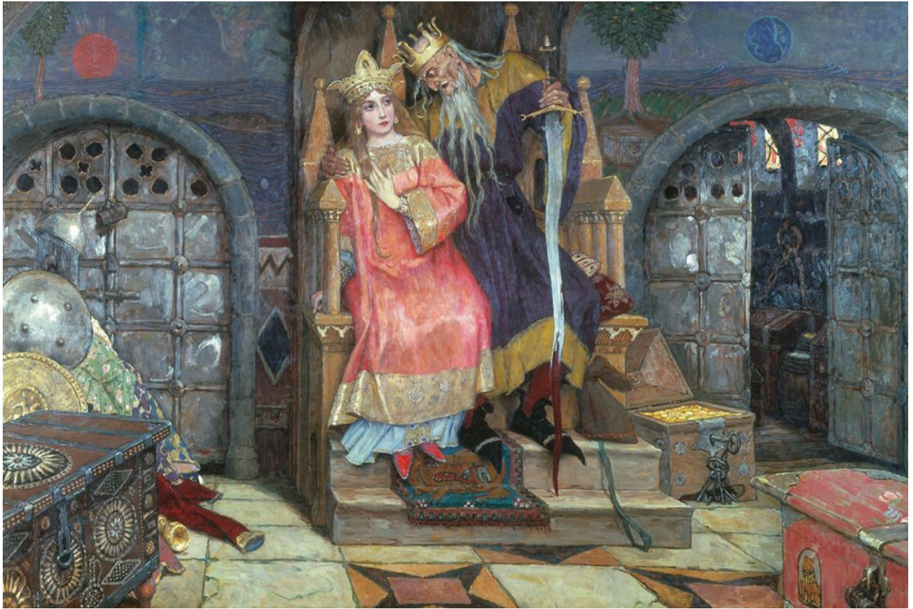
Kochtcheï l'Immortel, 1926