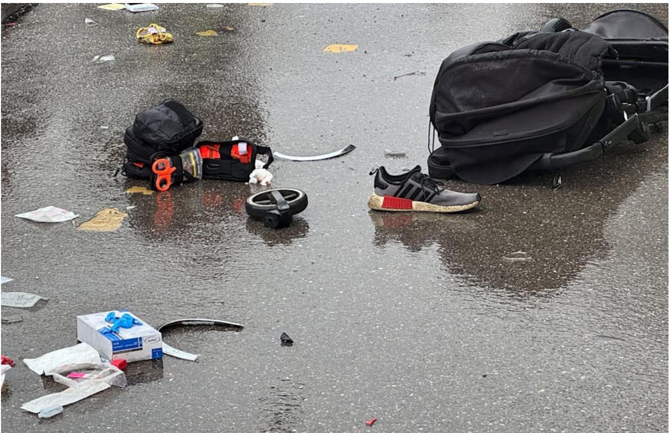
Ci-dessus : un sac à dos et une poussette appartenant à des manifestants gisent dans la rue