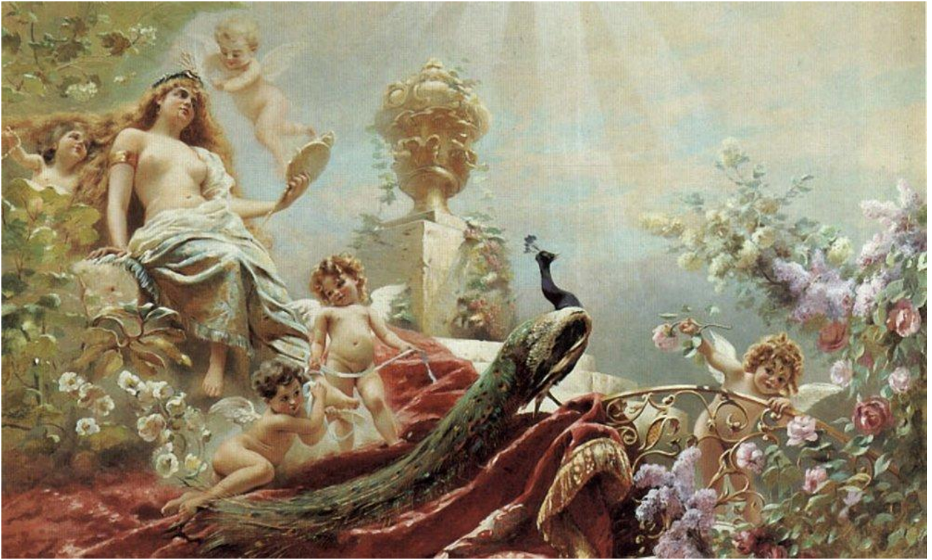
Toilette de Vénus