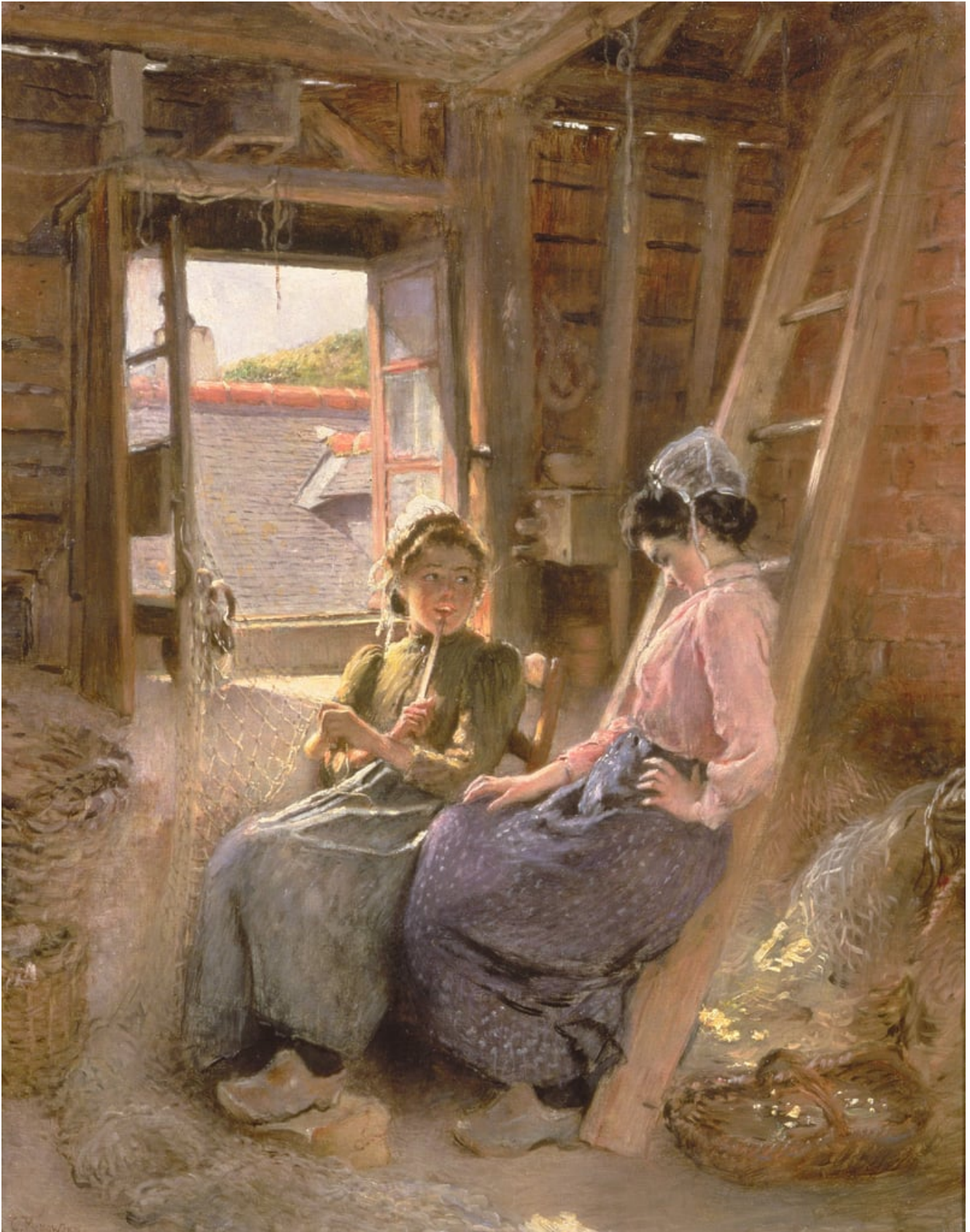
Deux femmes bretonnes, 1904