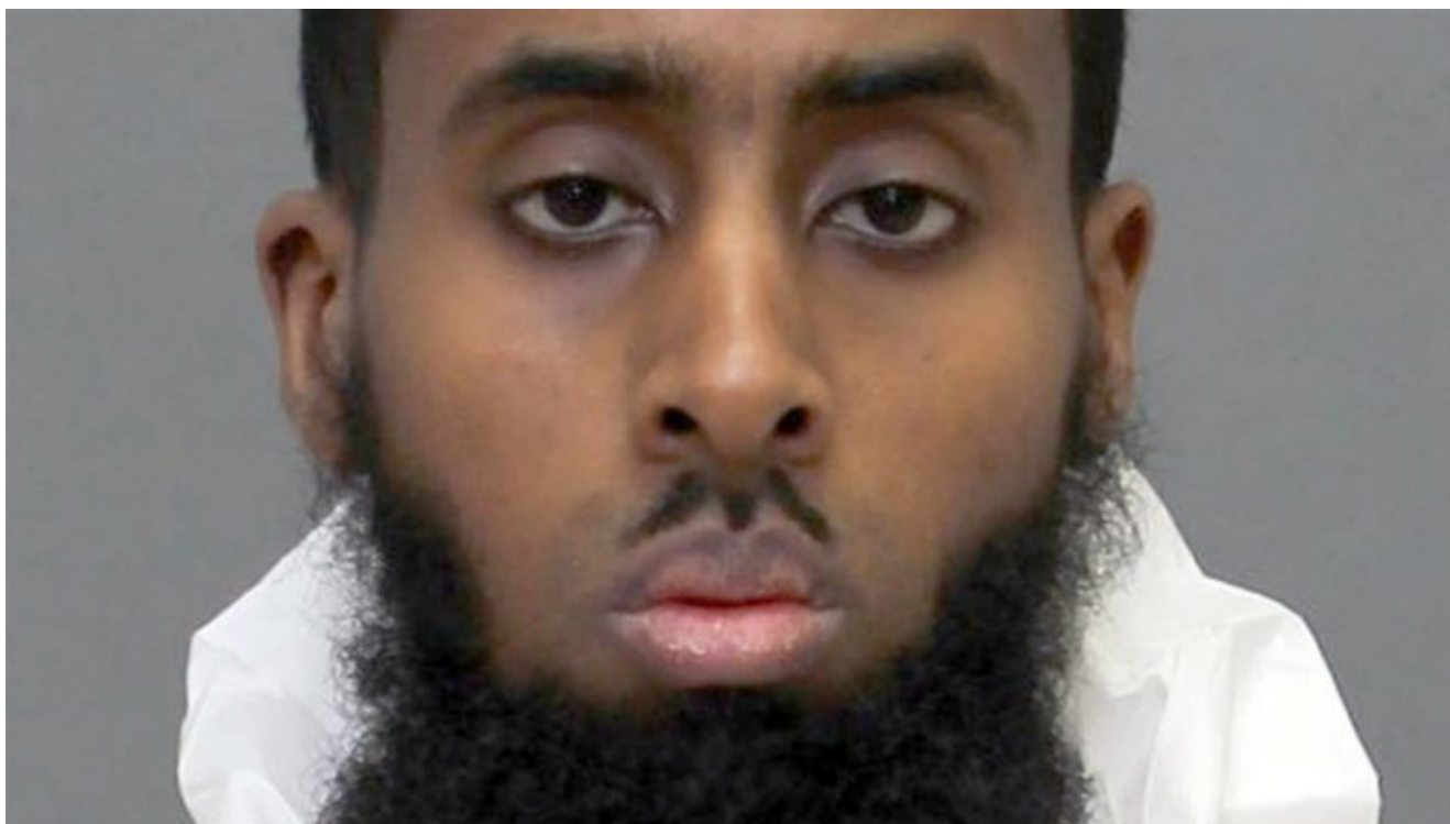
Illustration : Hassan Hanafi, militant islamiste somalien ayant aidé Al-Shabab à tuer cinq journalistes et condamné à mort : « Je suis indifférent si vous me tuez. Vous verrez si les tueries cesseront même après ma mort » ( BBCNews )