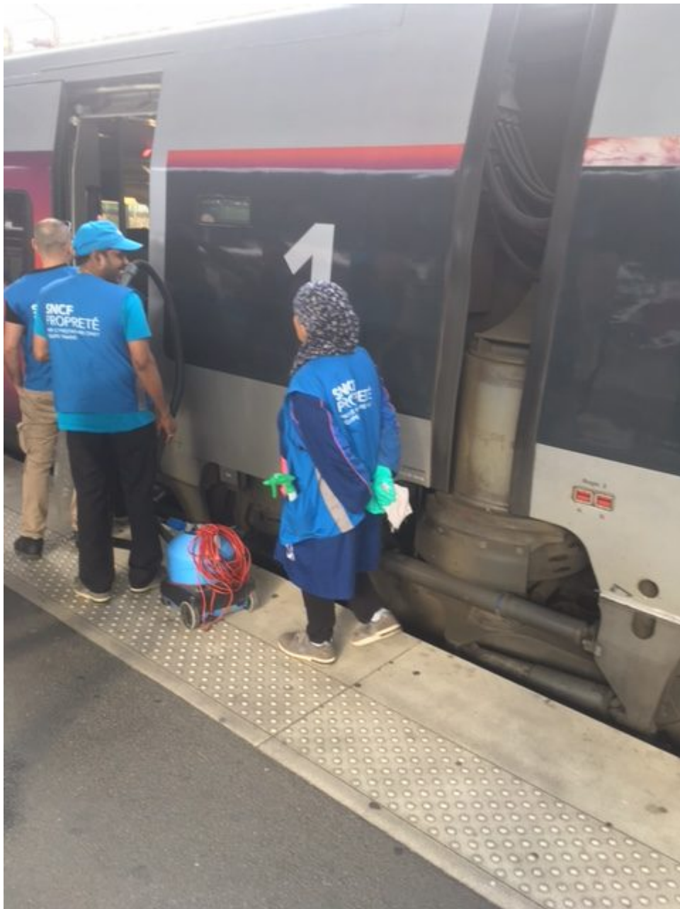
Illustration : grève en novembre 2017 des salariées de H.Reinier, succursale de Onet.