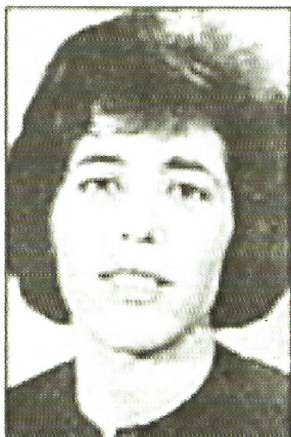
par Simone Gautier

Quels sont ces sauvages, où est la France ?