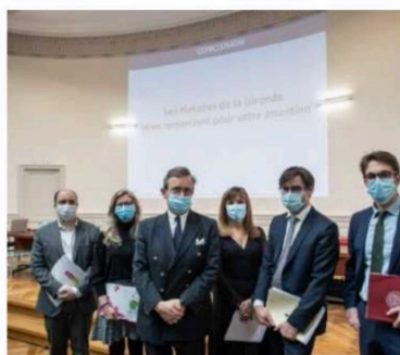
La Chambre des notaires de la Gironde présentait hier ses statistiques annuelles. THEORY DRIVO