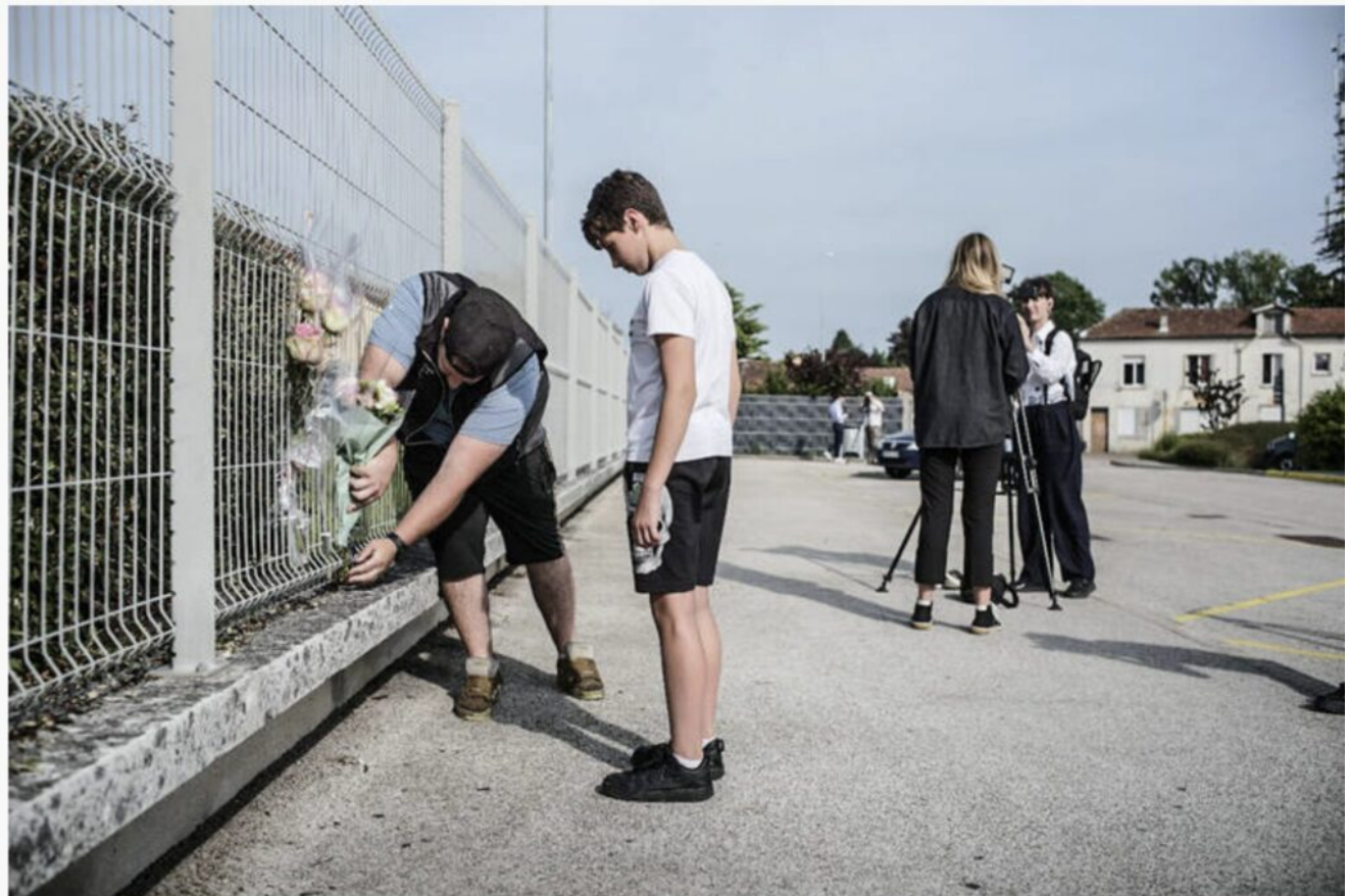
Devant le François-Dolto, à Nogent (Haute-Marne), le 10 juin 2025.

Encore un assassinat à l'arme blanche dans un collège, cette fois à Nogent en Haute-Marne !!! Mais jusqu'où ira, « mon frère », le squatter de l'Élysée dans sa destruction du peuple français ? Oui, squatter plutôt que squatteur □-nous pouvons utiliser un mot d'origine