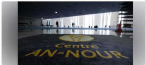
L. Le centre An-Nour, inauguré à Mulhouse en 2019, financé en partie par des dons en provenance du Qatar.

Si les joueurs... attaquants du PSG ont anéanti l'Inter, les spectateurs... défenseurs du PSG ne doivent pas oublier que le Qatar aide des mouvements... islamistes !