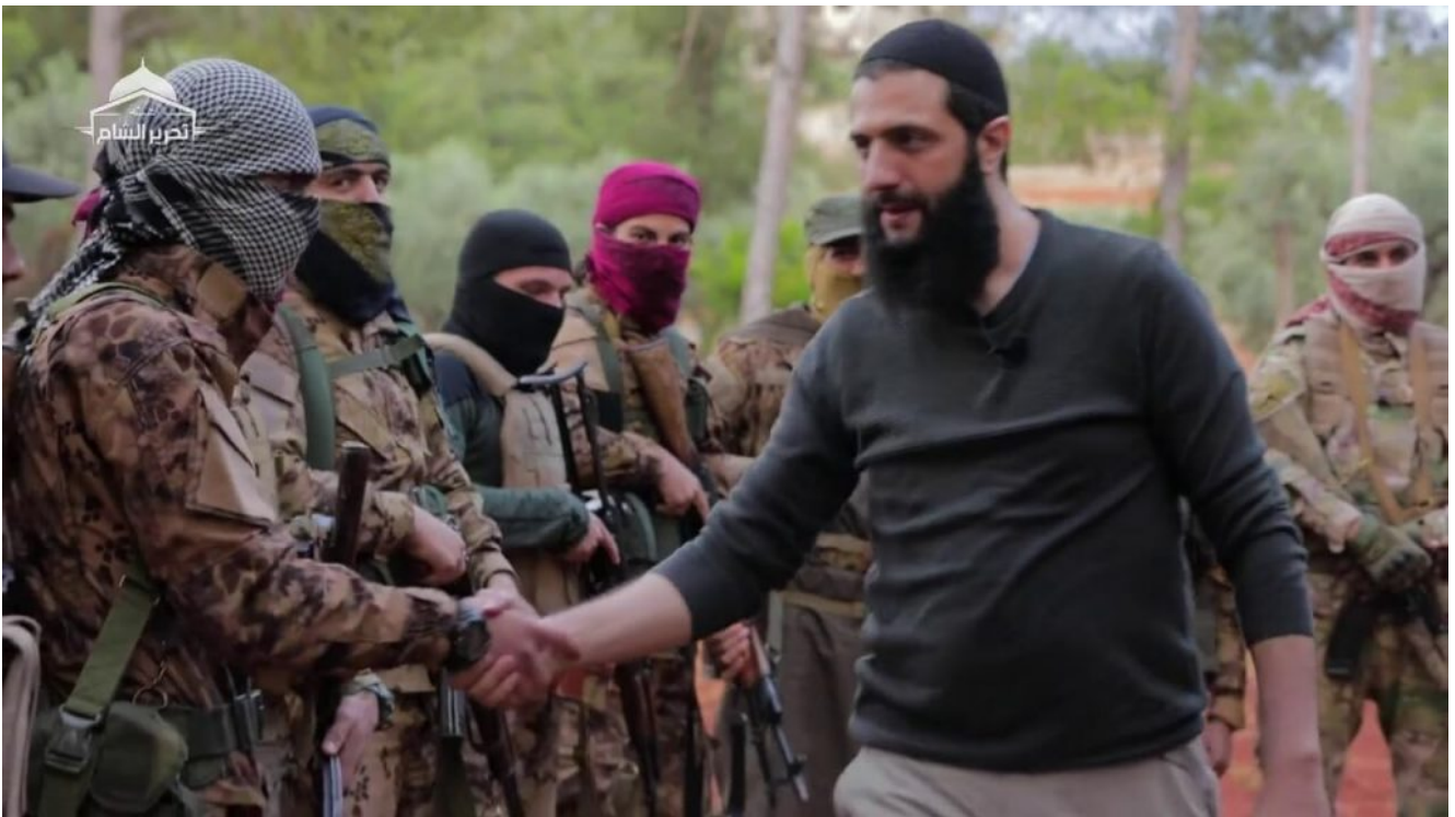
Illustration : le terroriste Ahmad al-Charaa (= Joulani) que Macron a reçu le 7 mai