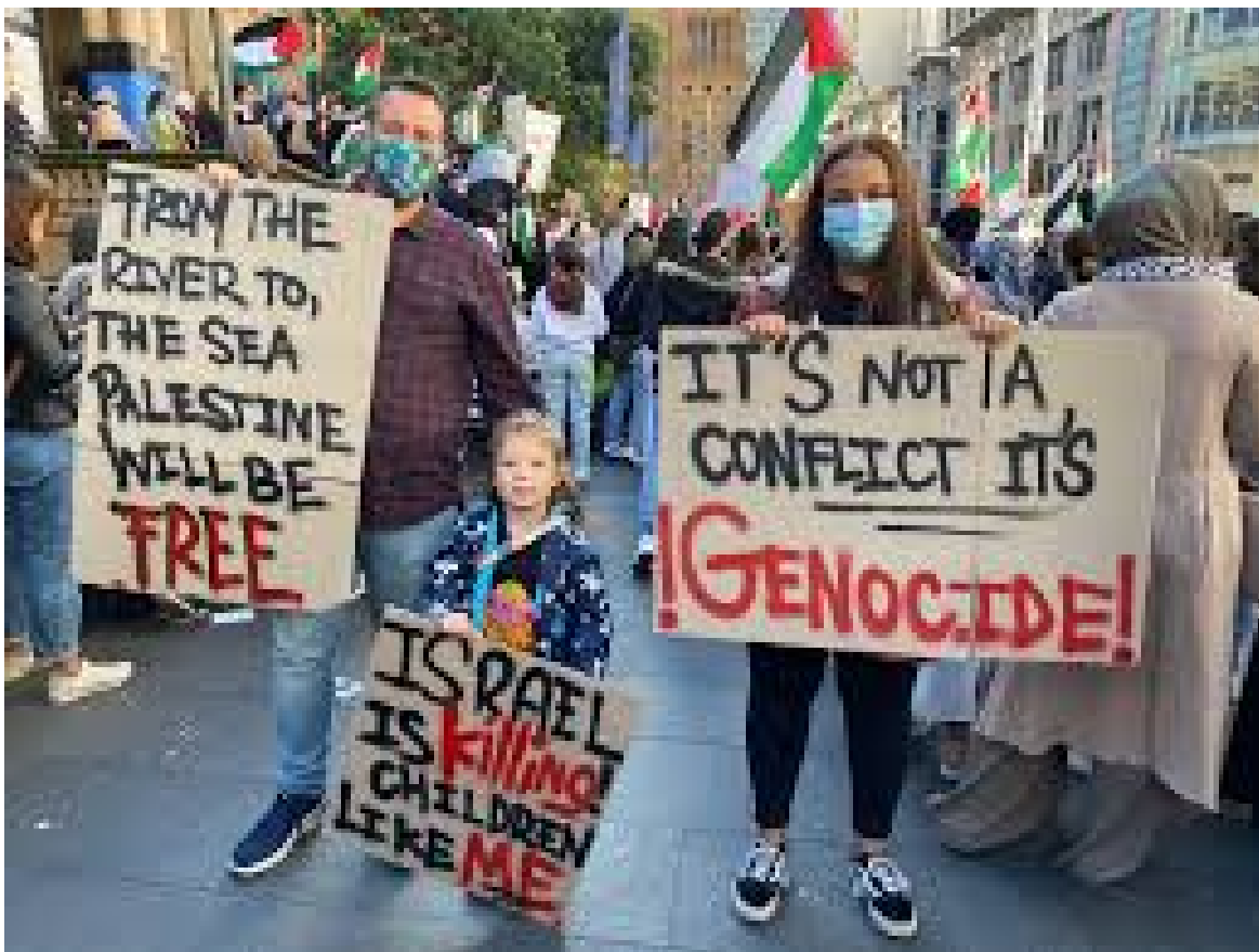
Manifestants anti-Israël au Canada 2023