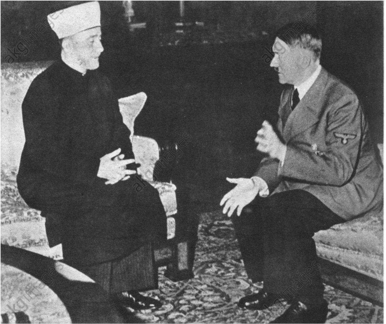
Le grand Mufti et Hitler à Berlin, le 28 novembre 1941.

En février 1943, Le Grand Mufti est intervenu dans la création; par Himmler , de la division de Waffen-SS « Handshar » composée principalement de musulmans bosniaques [21] . Le Mufti rédigea à leur intention une brochure intitulée « L'islam et la juiverie » où il rappelait les versets du Coran pour présenter les juifs comme des ennemis historiques de l'islam, il remontait aussi aux hadiths accusant les juifs de Médine de trahison et légitimant leur élimination par Mahomet (cf. plus haut). Il déclara devant les recrues musulmanes : « Le Reich mène le combat contre les mêmes ennemis, ceux qui ont spolié les musulmans de leur pays et anéanti leur foi religieuse en Asie, en Afrique et en Europe.