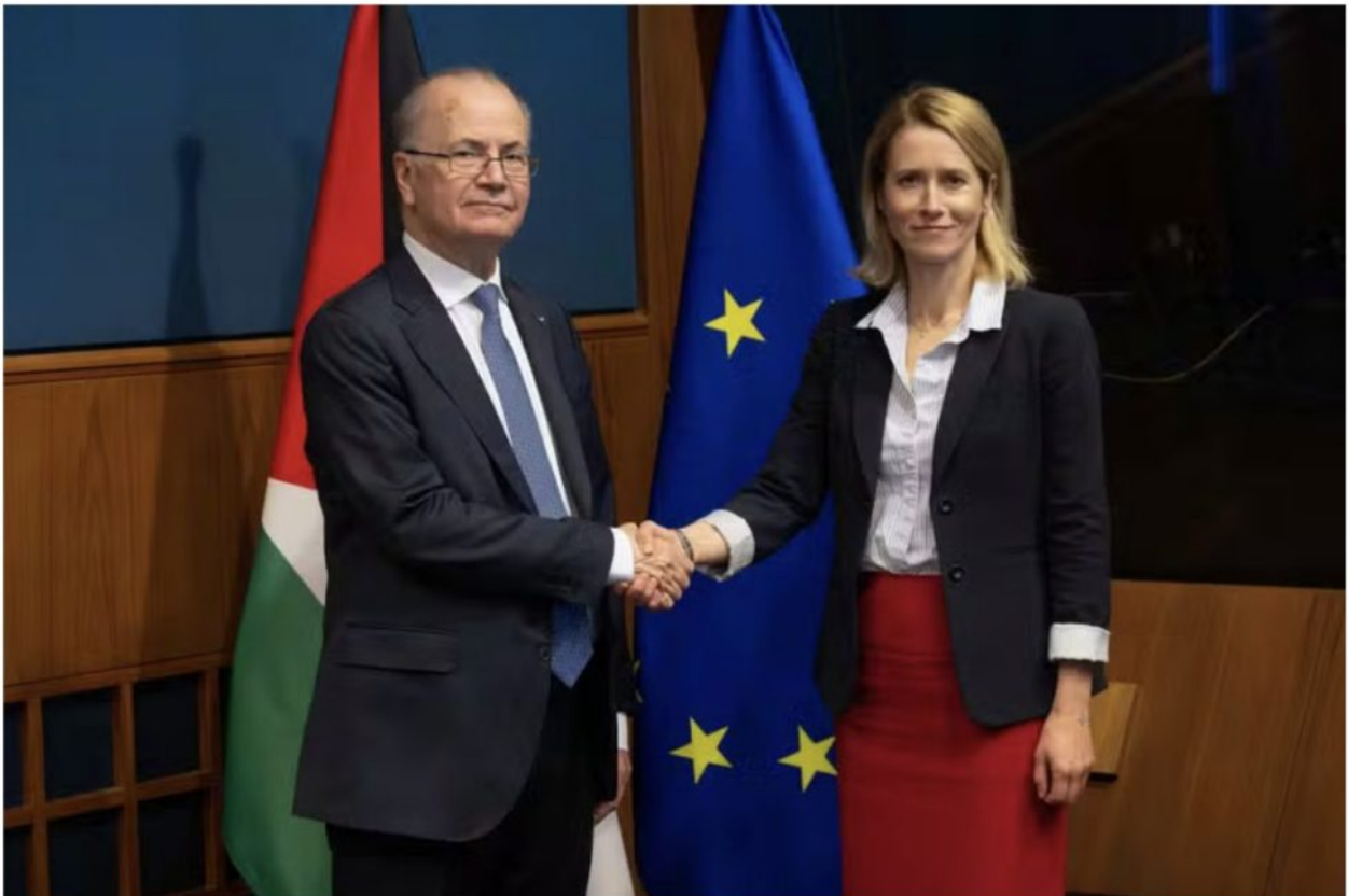
Le premier ministre palestinien, Mohammad Mustafa, avec la cheffe de la diplomatie européenne, Kaja Kallas, à Luxembourg, le 14 avril 2025.

L'UE promet 1,6 milliard d'euros pour l'Autorité palestinienne