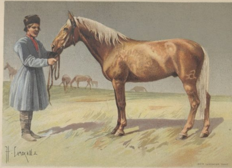
KALMOUK (8 ans taille 1 m 50 c ) Etalon de race kalmouk, offert par les Kalmouks à S. A. S. le Grand Duc Héritier de Russie.