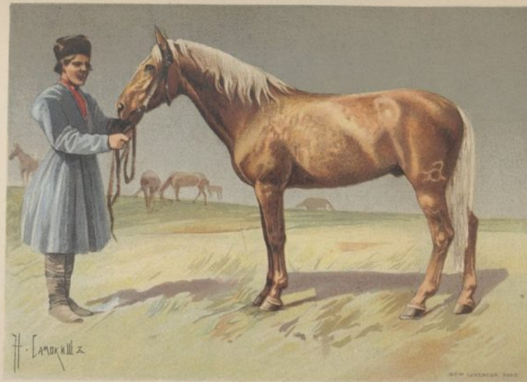
KALMOUK (8 ans taille 1 m 50 c ) Etalon de race kalmouk, offert par les Kalmouks à S. A. S. le Grand Duc Héritier de Russie.