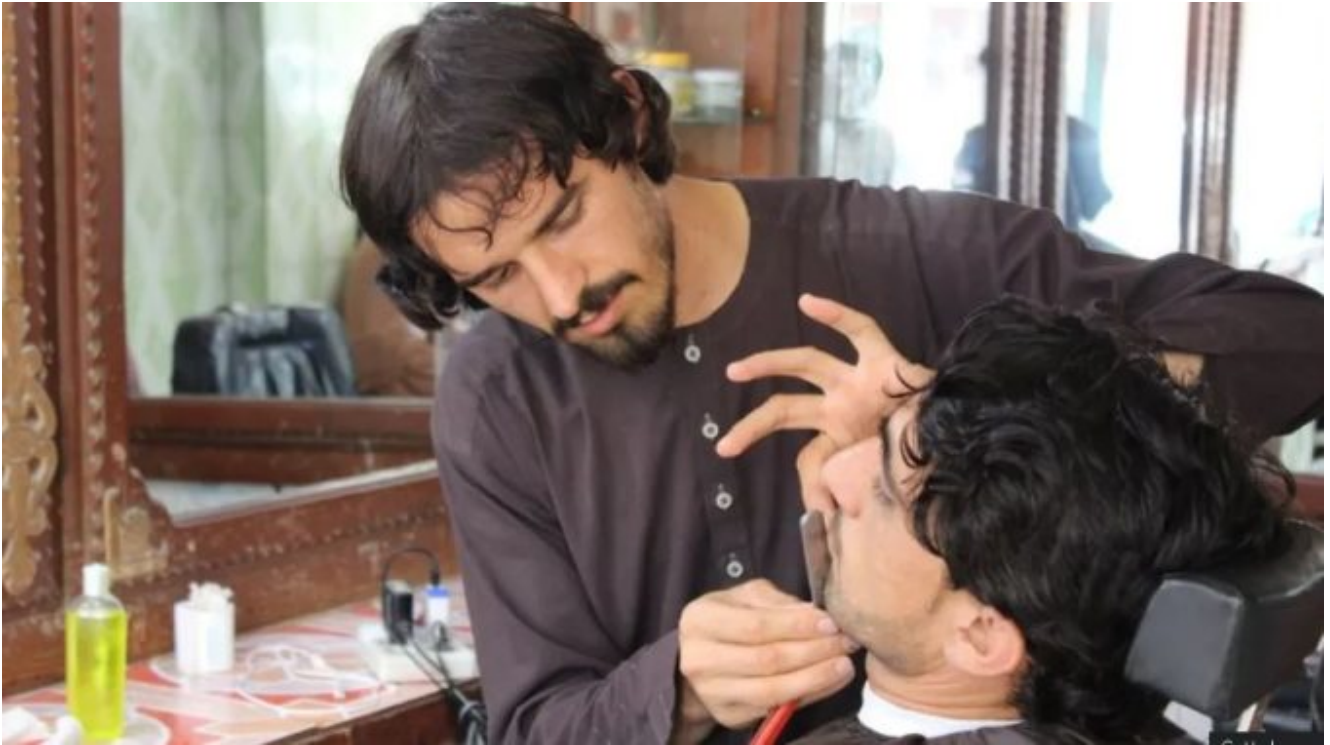
Un barbier afghan

Ces lois offrent une vision angoissante de l'avenir du pays en s'ajoutant aux restrictions existantes en matière d'emploi, d'éducation et de code vestimentaire imposées aux femmes et aux jeunes filles. Les responsables talibans ont rejeté les préoccupations de l'ONU concernant les lois sur la moralité.