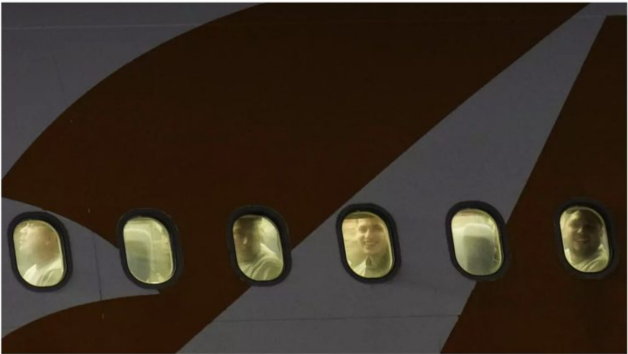
Des migrants vénézuéliens expulsés des États-Unis regardent par les hublots de leur avion à leur arrivée à l'aéroport international Simón Bolívar de Maiquetía, au Venezuela, le 24 mars 2025.