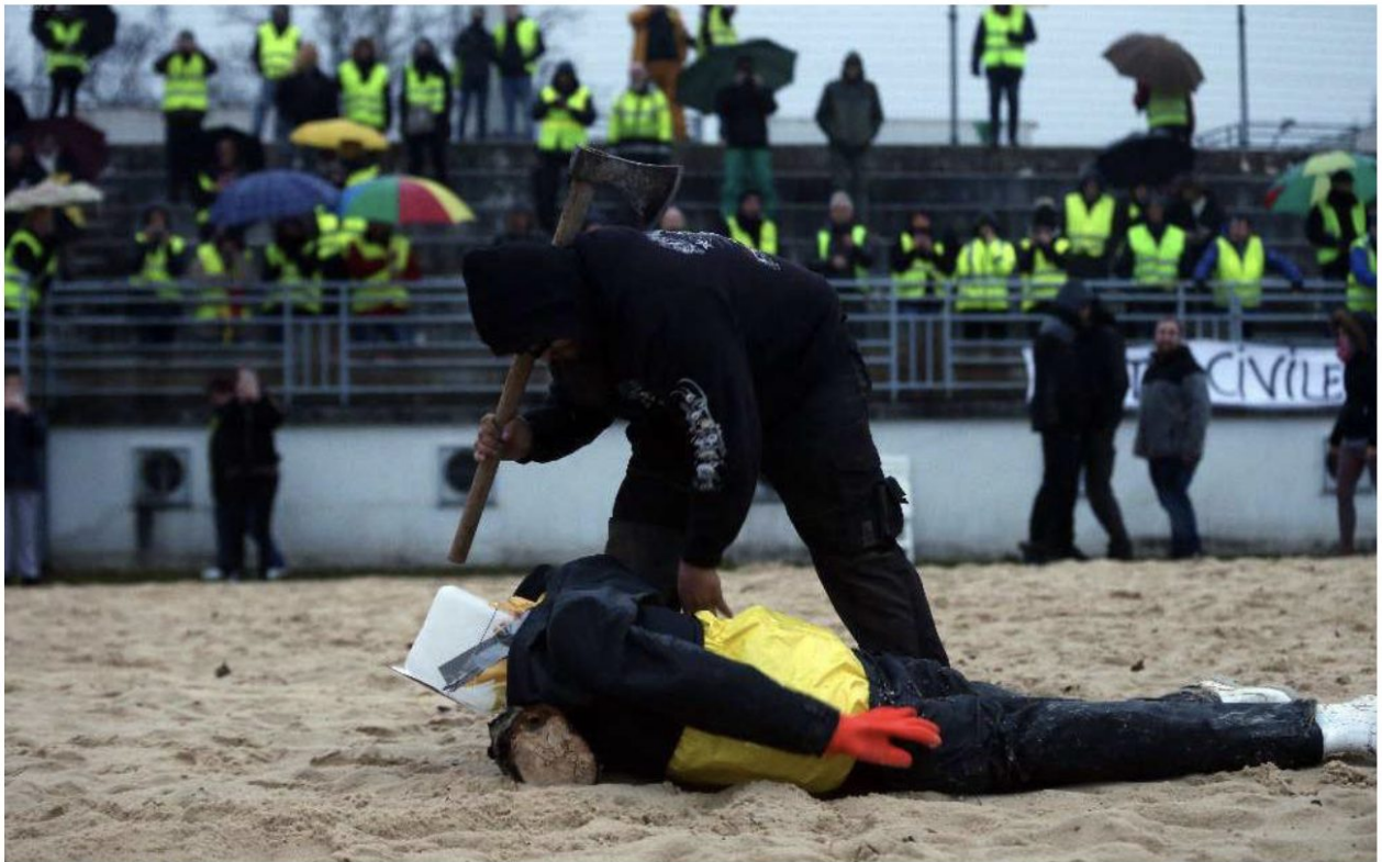
La saynnette avait été jouée à Bourgines, devant une cinquantaine de gilets jaunes