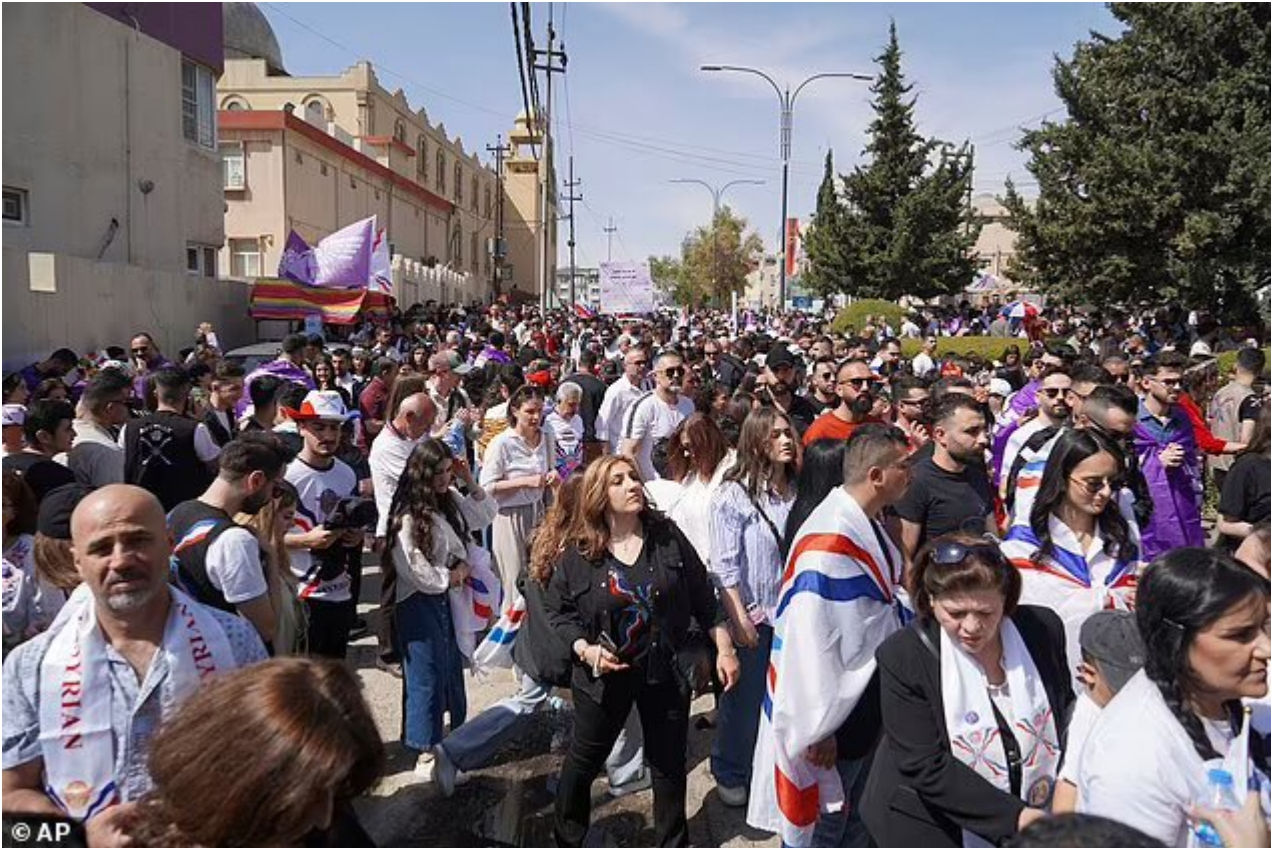
Des chrétiens assyriens vêtus de vêtements traditionnels assistent à l'« Akitu », les célébrations du Nouvel An assyrien, à Dohuk, en Irak, le mardi 1er avril 2025.