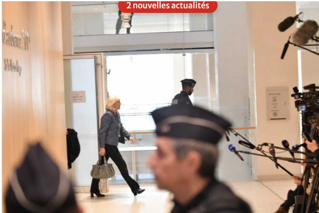
Marine Le Pen a quitté le tribunal dès qu'elle a appris être inéligible, sans même attendre le prononcé de la peine. Elle a écopé de 5 ans de prison dont deux ferme, sous bracelet électronique.

Inéligibilité donc pour Marine qui ne pourra pas se présenter en 2027. On s'y attendait tout en se demandant s'ils oseraient, je me disais même qu'ils n'oseraient pas , histoire de conserver une Marine quelque peu médiocre face au candidat du système, un copain de Macron, un Edouard Philippe, un Wauquiez... bref un zozo qui donnerait l'assurance que le candidat patriote, quel qu'il soit -et Marine était plutôt bien placée- serait éliminé, permettant à l'élu de 2027 de continuer l'oeuvre de démolition des mondialistes-européistes.