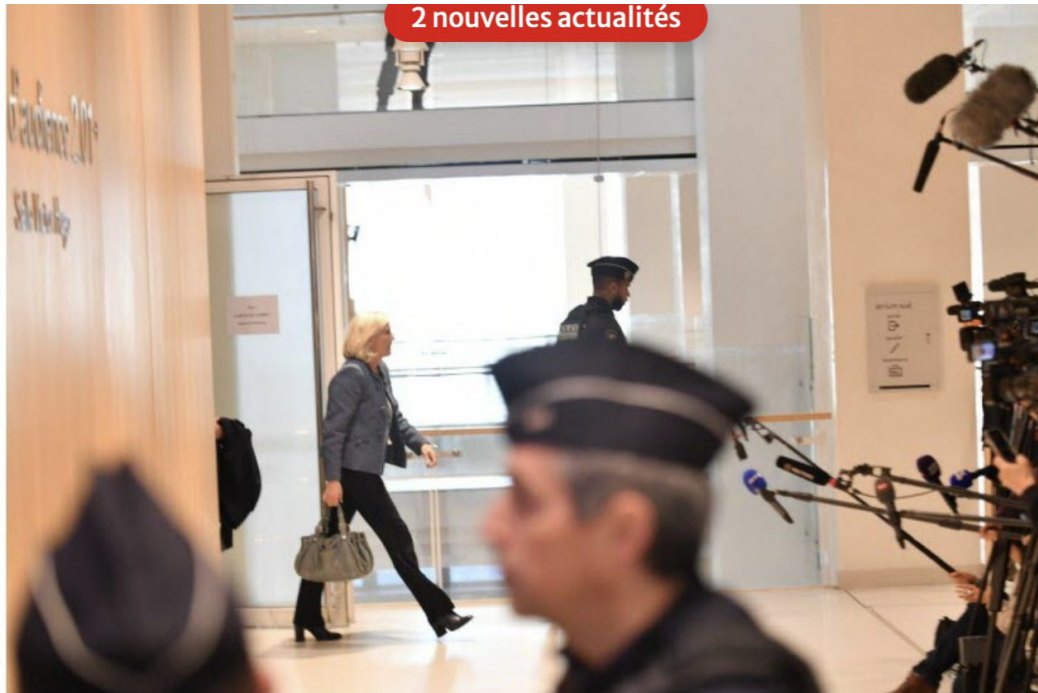
Marine Le Pen a quitté le tribunal dès qu'elle a appris être inéligible, sans même attendre le prononcé de la peine. Elle a éclopé de 5 ans de prison dont deux ferme, sous bracelet électronique.

Inéligibilité donc pour Marine qui ne pourra pas se présenter en 2027. On s'y attendait tout en se demandant s'ils oseraient, je me disais même qu'ils n'oseraient pas , histoire de conserver une Marine quelque peu médiocre face au candidat du système, un copain de Macron, un Edouard Philippe, un Wauquiez... bref un zozo qui donnerait l'assurance que le candidat patriote, quel qu'il soit -et Marine était plutôt bien placée- serait éliminé, permettant à l'élu de 2027 de continuer l'oeuvre de démolition des mondialistes-européistes.