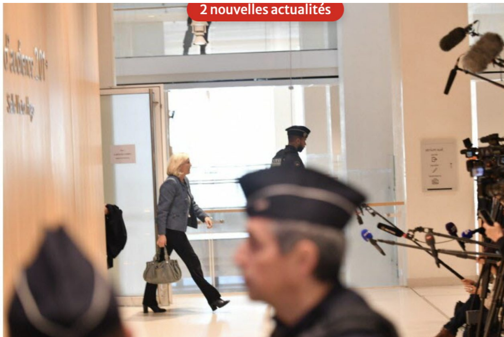
Marine Le Pen a quitté le tribunal dès qu'elle a appris être inéligible, sans même attendre le prononcé de la peine. Elle a écopé de 5 ans de prison dont deux ferme, sous bracelet électronique.

Inéligibilité donc pour Marine qui ne pourra pas se présenter en 2027. On s'y attendait tout en se demandant s'ils oseraient, je me disais même qu'ils n'oseraient pas , histoire de conserver une Marine quelque peu médiocre face au candidat du système, un copain de Macron, un Edouard Philippe, un Wauquiez... bref un zozo qui donnerait l'assurance que le candidat patriote, quel qu'il soit -et Marine était plutôt bien placée- serait éliminé, permettant à l'élu de 2027 de continuer l'oeuvre de démolition des mondialistes-européistes.