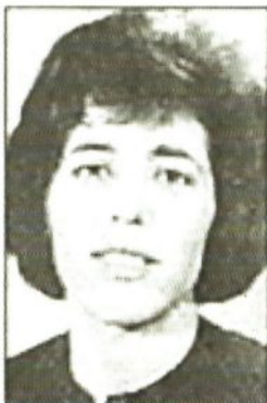
par Simone Gautier

À midi, il est rentré pour le déjeuner. Il avait l’air soucieux, comme triste aussi. Les enfants le sollicitaient beaucoup. Il m’a seulement dit qu’il avait vu un spectacle affreux. Il me semble me souvenir qu’il était