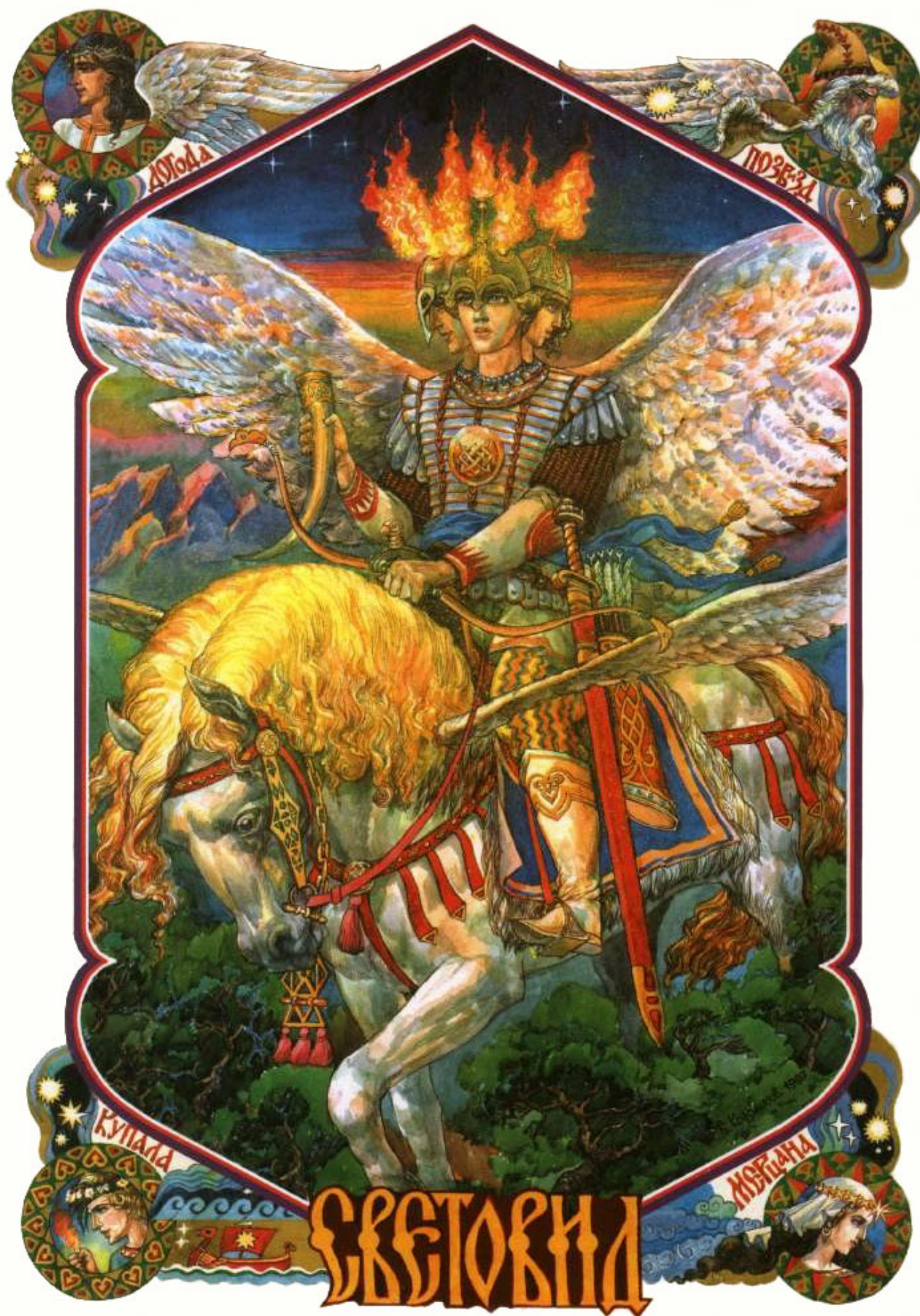
Svantovit – le dieu de la guerre, du soleil, de la victoire contre les Slaves de l'Ouest, était représenté