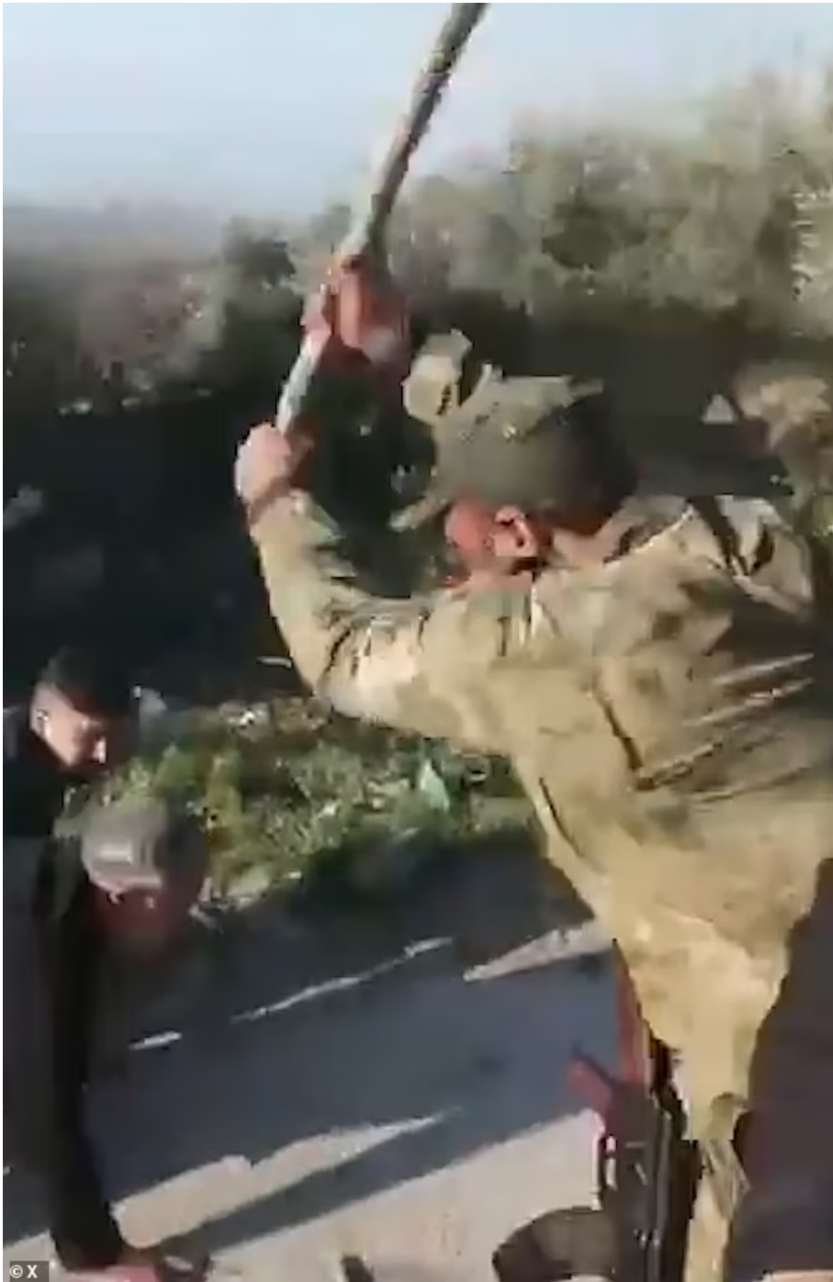
Un commandant du HTS frappe des civils qui ont été forcés de ramper le long d'un chemin de terre.