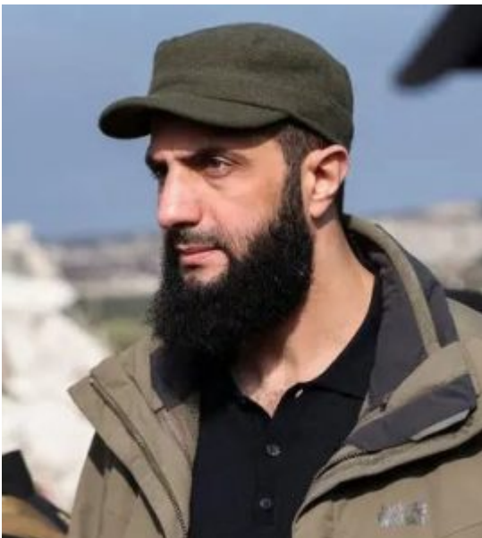
Photo : le président syrien par intérim, Ahmad al-Sharaa (qui n'est autre que le terroriste Joulani), signe la déclaration constitutionnelle du pays, qui sera appliquée pendant une période de transition de cinq ans, au palais présidentiel de Damas, le 13 mars 2025.