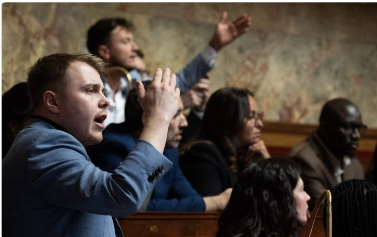
Incident lors d'une réunion du CCIE à l'AN.

La tension est montée d'un cran le mercredi 12 mars, alors que Raphaël Arnault, député de La France Insoumise, a pris la parole dans une réunion à caractère sensible contre l'islamophobie, en présence du CCIE et a refusé l'entrée aux députés Hanane Mansouri et Charles Alloncles.