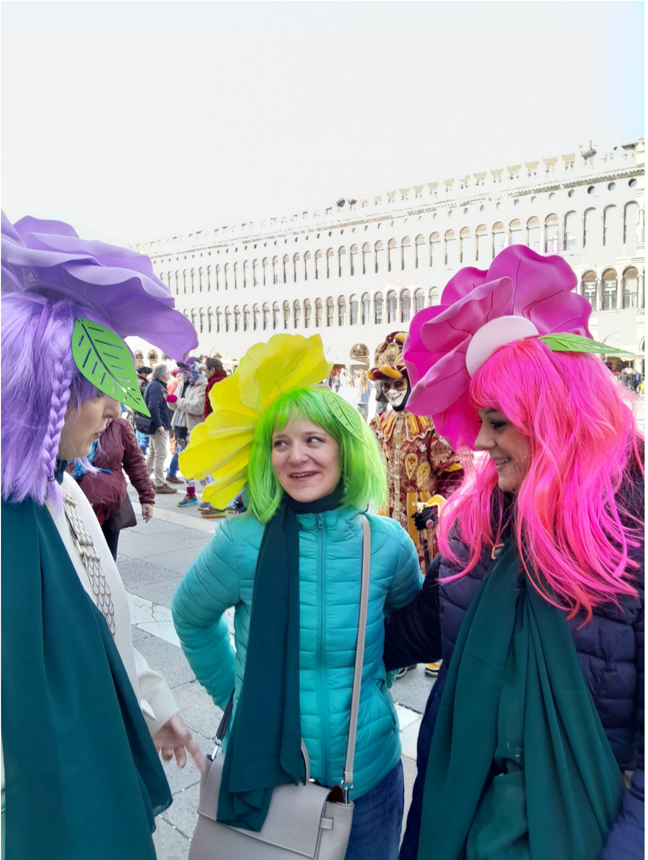
Somptueuse à souhait, plus que marquise, souveraine,