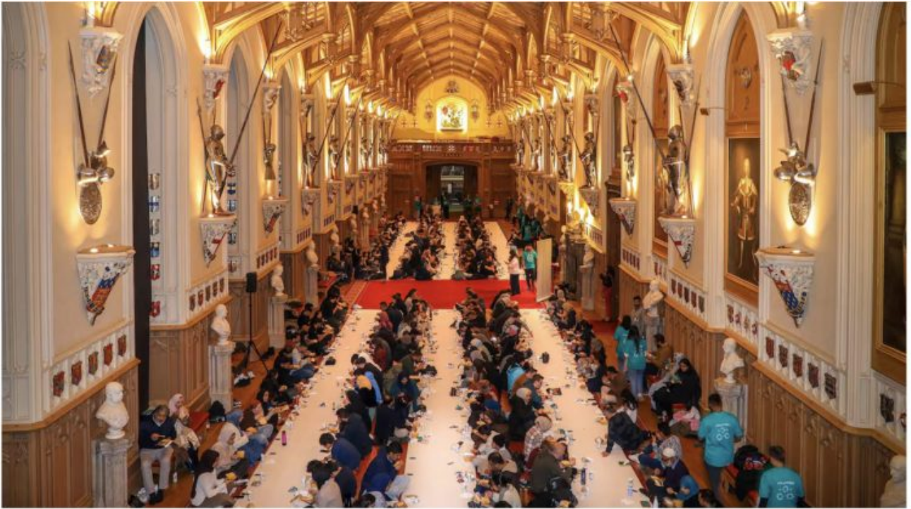
St George's Hall, dans les appartements d'État du château de Windsor, au Royaume-Uni, a accueilli un ffour géant le 2 mars à l'occasion du mois de ramadan.