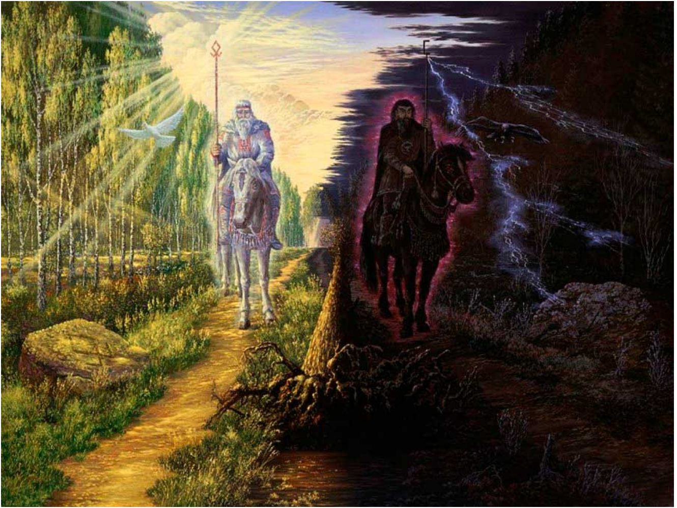
Belobog ( le dieu blanc) et Tchernobog ( le dieu noir).