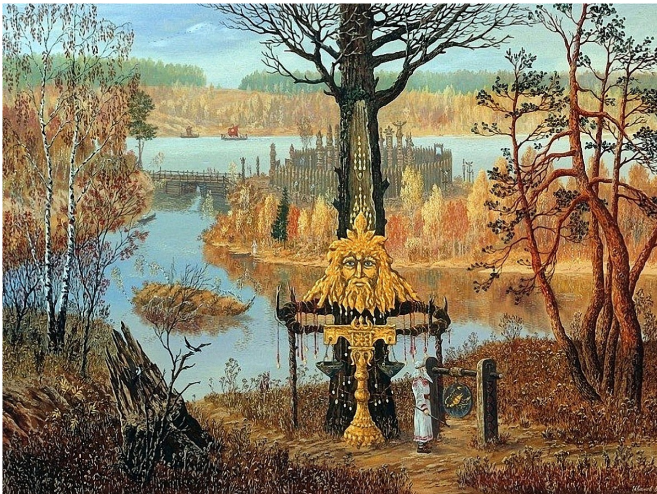
L'esprit du mois d'Ovsenich (octobre)

Ses peintures dépeignent principalement des paysages idylliques, montrant les ancêtres de son peuple en contact avec des dieux, des dragons et d'autres créatures mythiques.