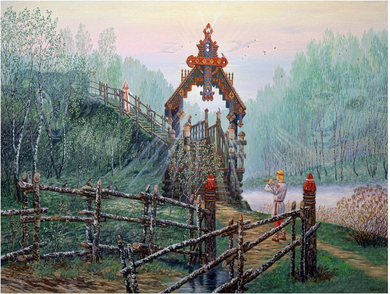
Bloom (avril). Lel et Lada