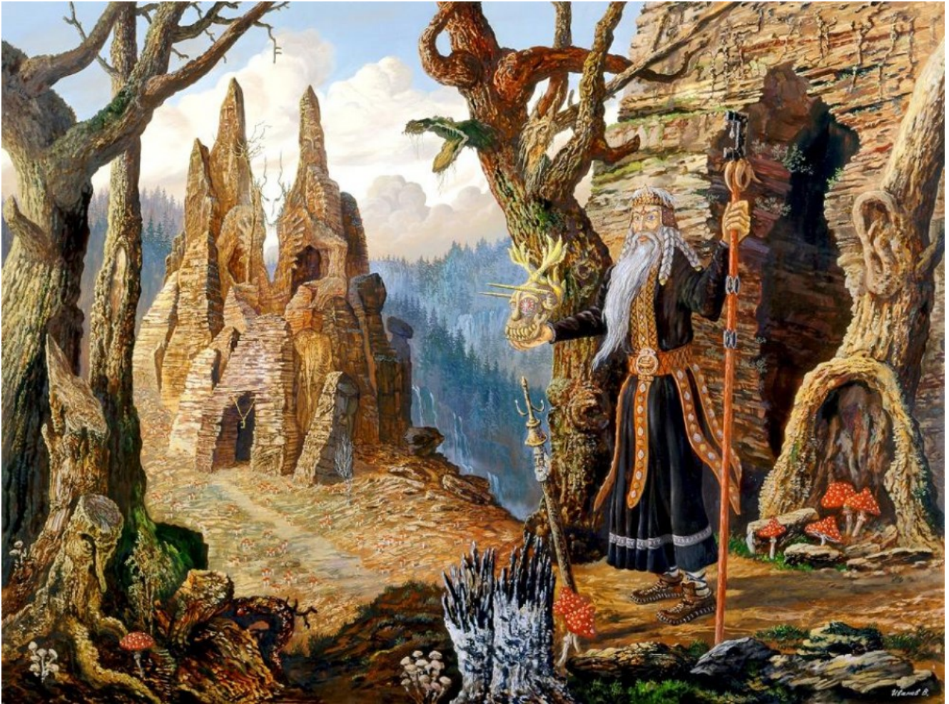
Un volkhve, druide slave, en harmonie avec la nature.