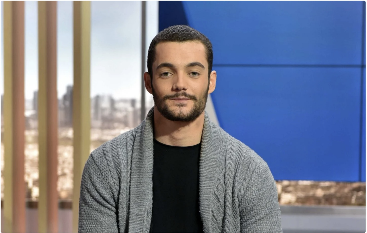
L'association SOS Racisme - Touche pas à mon pote a saisi la justice pour signaler des propos incendiaires tenus par Louis Sarkozy dans un entretien au « Monde ».

Les droidelhommistes castrateurs, on connaît. On ne connaît même que trop bien à Résistance républicaine . N'ai-je pas été condamnée pour avoir crié « islam assassin » après l'atroce mort des policiers de Magnanville ?