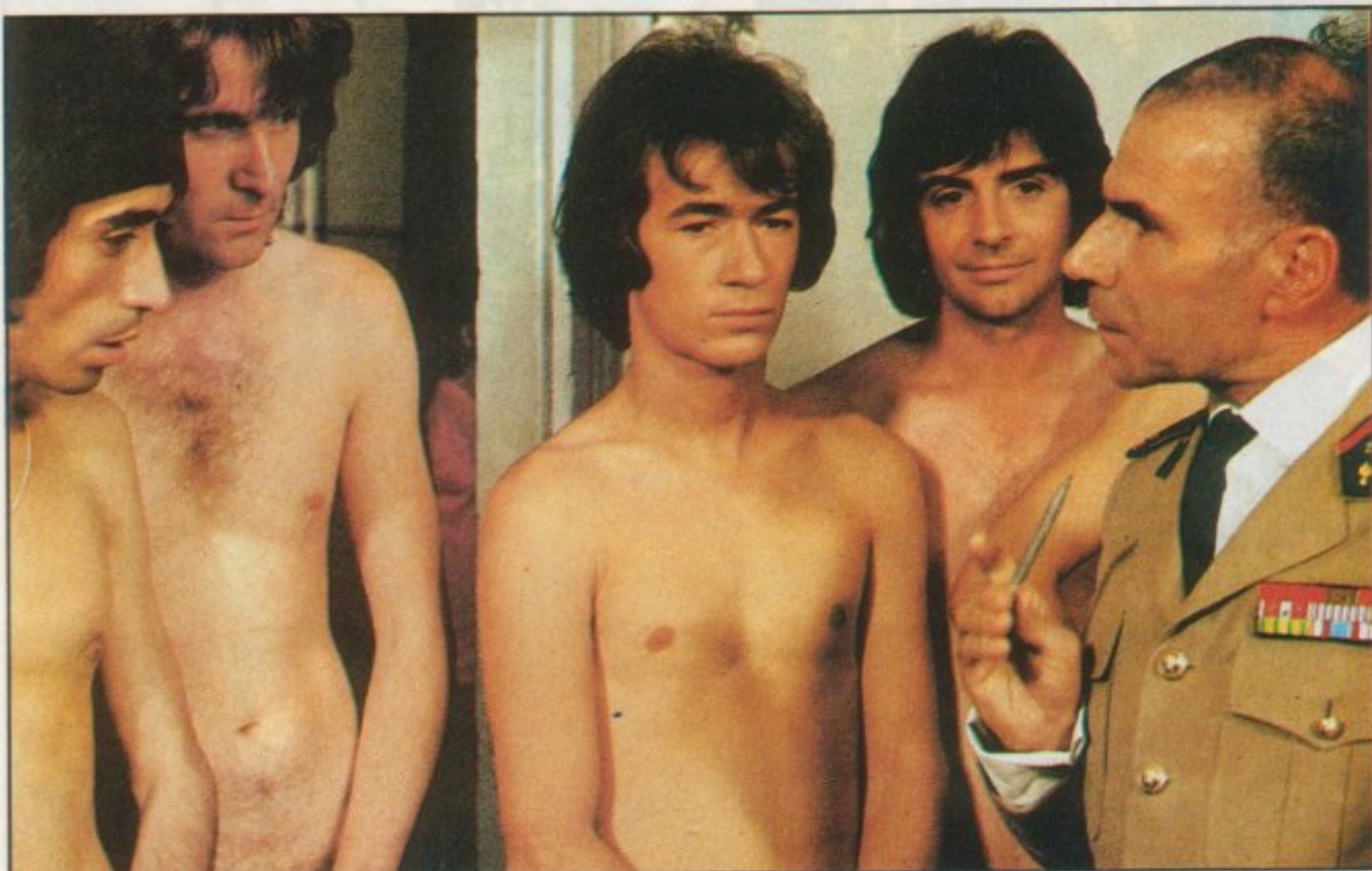
Les Charlots sous l'œil de leur colonel (Jacques Dufilho).

Avec Gérard Rinaldi : Gérard ● Gérard Filipelli : Phil ● Jean Sarrus : Jean ● Jean-Guy Fechner : Jean-Guy ● Luis Rego : Luis ● Marion Game : Crème ● Jacques Dufilho : le colonel ● Jacques Seiler : Henri Lambert.